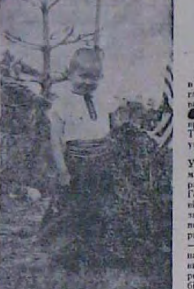
I в Німеччині не без позаків