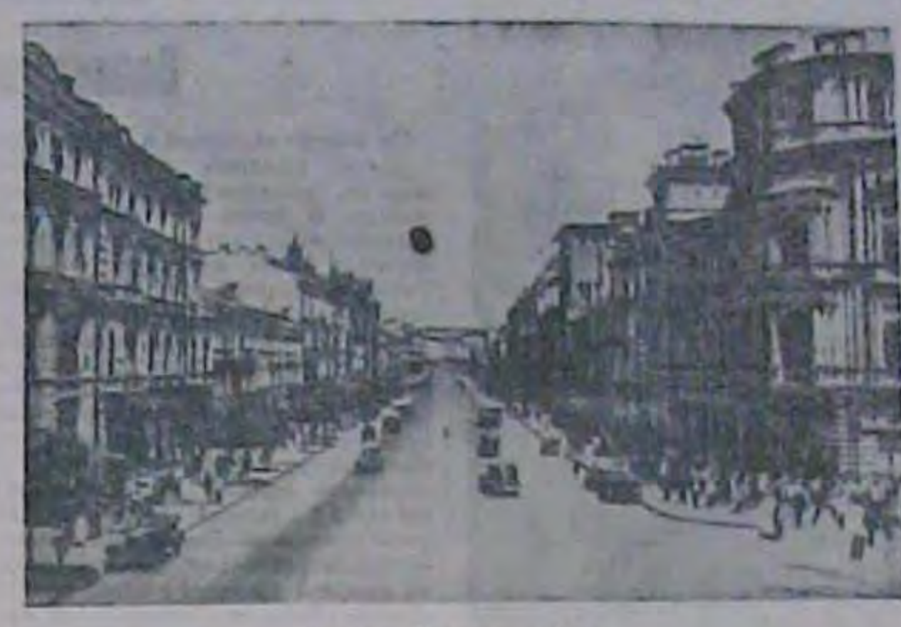
Красупь України - Квіп.

Комітет повідомаяс, що, маючи варе: живеться по-молському. вих таборах, неі макоть дозволи на тато ітанійнія та францумія), падас за- селон в дітома чекля тут пуме важиг виня в Аргентыу через Італю, а та- робітна плата, шлимаються шив, при полемірация. ком Іхию зголу, мін міг би допологти скрутніше з поменіканням. Питають в шій справі. Тому просать всіх запі- головно за вінками-служнацяма до при-