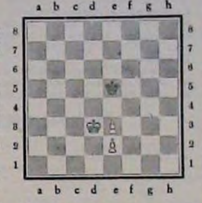
Білий ваграе, незалежно від того, хто