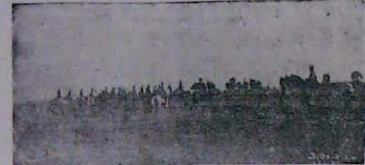
Дефіляда кінного поєму Запорізької дивізії в 1918 р. (З книги «Українські збройні сили» З. Стефаніва).

1. Кр g2—h1 з огляду на положення пішака, білий не може осягнути