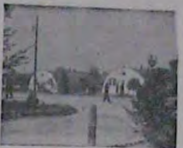
Гієсея. Так виглядають англійські бочки.

Таборові Ради повинні вжити негайних заходів до виконання згаданої постанови Управи ЦПУЕ. ПРЕЗИДІЯ ЦПУЕ