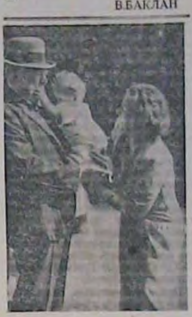
Під час пам'ятокського конгресу в Гаазі Черчіл дуже „запрятлюва“ з доведкою голландської прашпеси Юліана (Дена)

Одверта подіка Дізна Київський російський драматичний театр закінчив свої гастролі в Москві. З цієї нагоди Комітет у справах мистецтва при Раді міністрів СССР висловив театрові гарну подяку за те, що він, мовляв, пропонує в Україні російське мистецтво. Що й казати—подіка одверта!