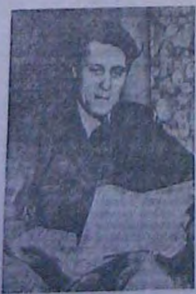
til J. asspunse onin moor. (Henn-HIT)

Tau pocificana razera "Hocen" (ч. 23, п. р.), принесла "сепсанияну" вістку, що на жевевській ірозській конференції в справах втівачівінтелектуалів були запрошені тільки двое росіян, тоді як "від польських україннів буда делеганія з 10 чоловіка". Ця наївна брехенька (бо на конференції були не "польські українції", а просто українці, в тому також відомі всім-і "Посс-