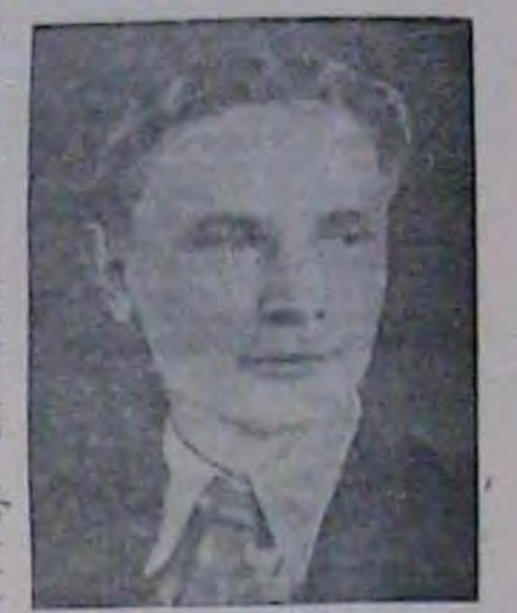
MAKCIM TAHK пидатинй сучасний поет-ерія