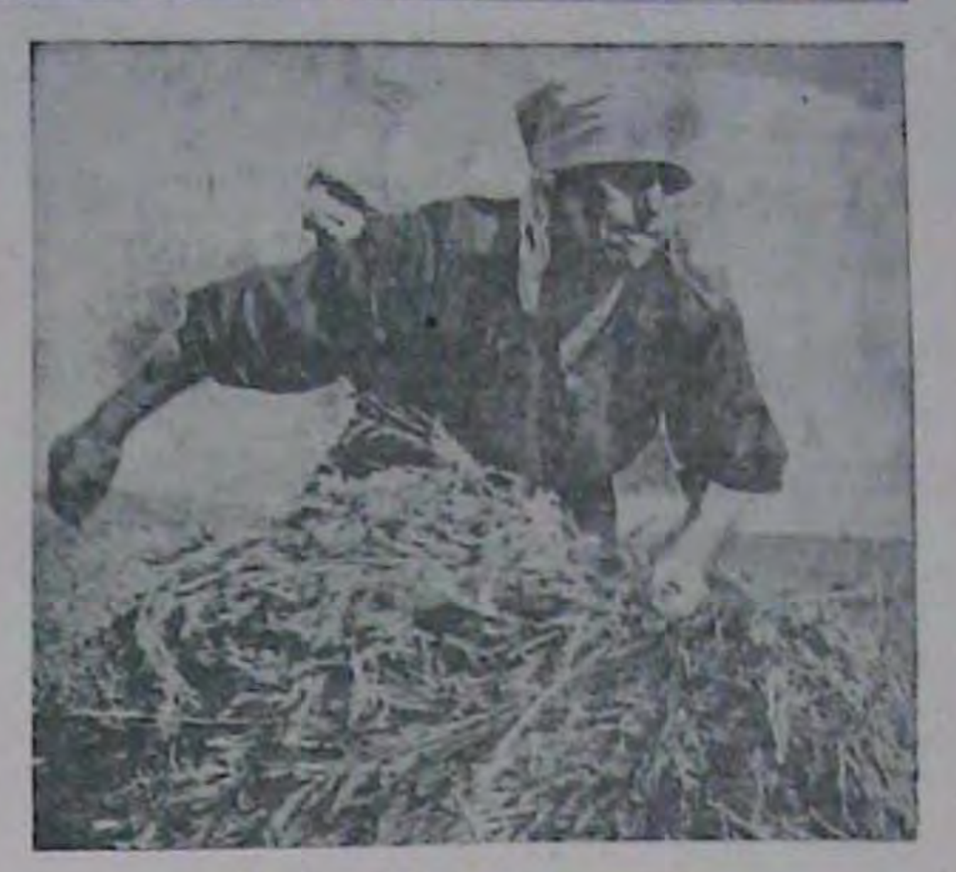
Українська жінка на колгосиному полі.