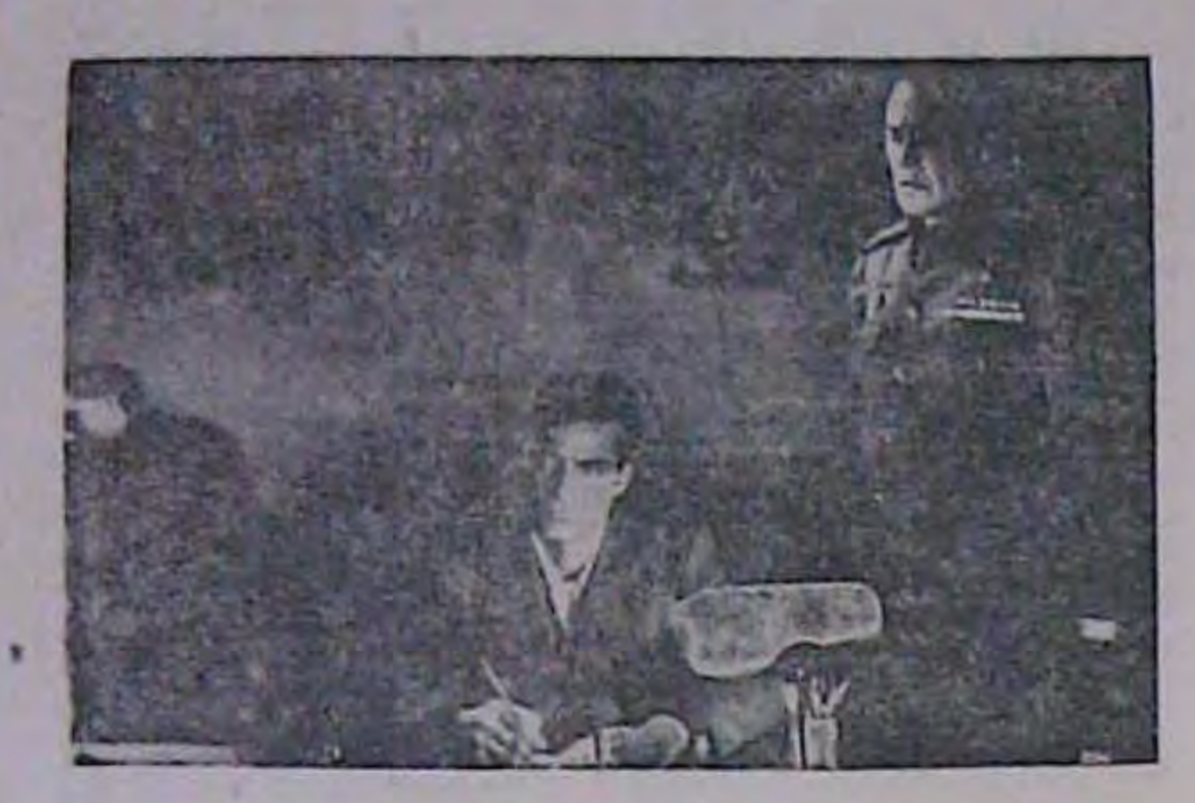
кадр в вмерика иського фільму про Ігоря Гудзенка. Фільм розкриває методи советської розвідки