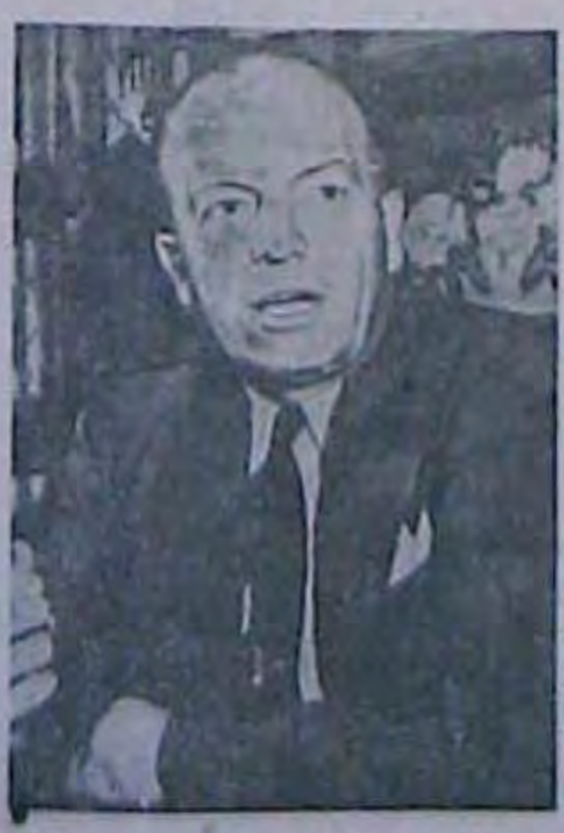
Каплалат на празвлента США (Asna-lill) F. Creecen

БУДАПЕШТ (ЮП). 15 червия. У неділю в церавах Угоринии прочитано