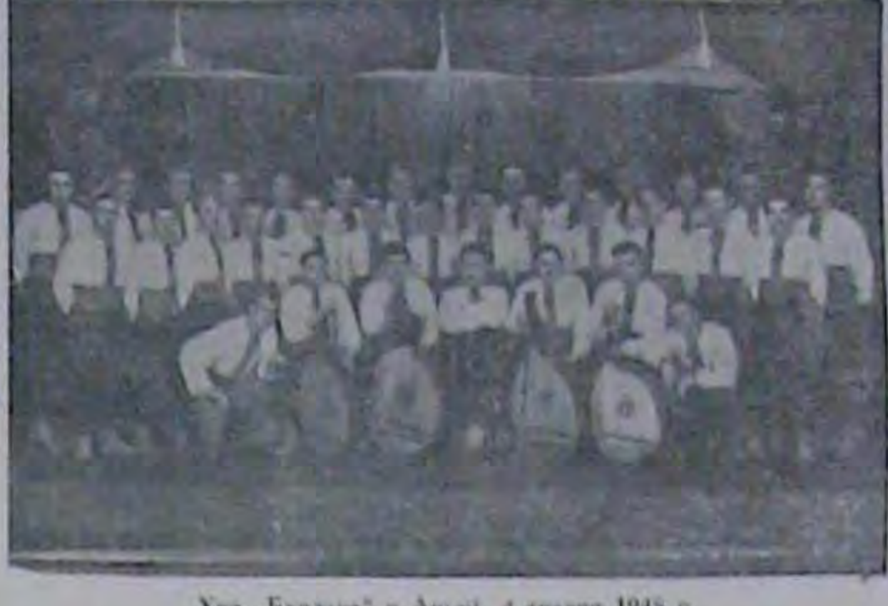
Хор "Бурласа" в Ашлії, 4 трания 1948 р.

Познки на переїзд до Арґентіни. Як повідомане газета "Канадійський ранов", Український Допомоговий Комітет в Італії почав видавати окремим Вси матеріяльна культура Венесуелі, українським скитальцим позики для оплати переізду до Аргентіни. Є відомості, що скитальці з Австрії і може