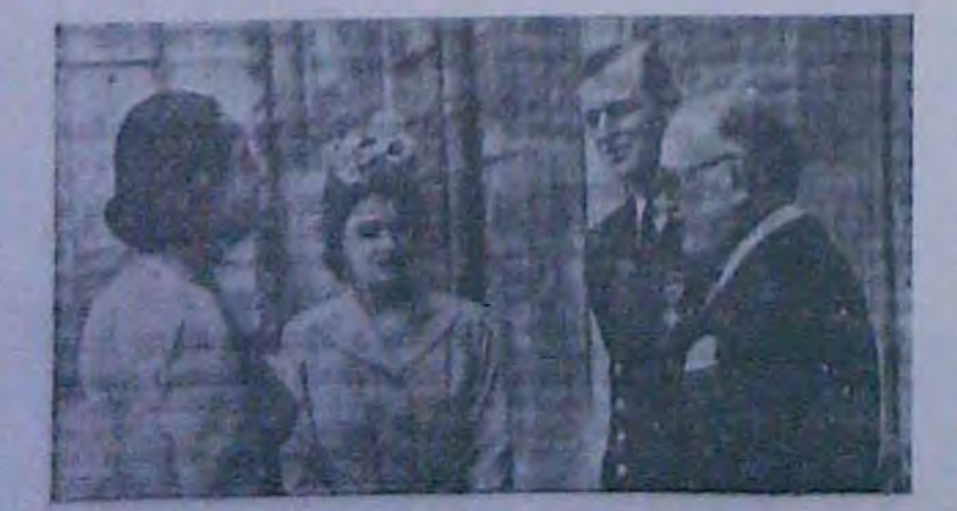
Принисса Сливаета I II чоловів терпог Едінбурлький гостивали недапно о фольнувакого президента Опісля че пого доужини (Hann HDA)

АТЕНИ (Зюдена-АФП). 6 червии. Офіційно сповішлють, що одружения румунського екс-короля Миханла в принцесою Анною Парною Бурбонською відбудеться 10 червня в Ате-