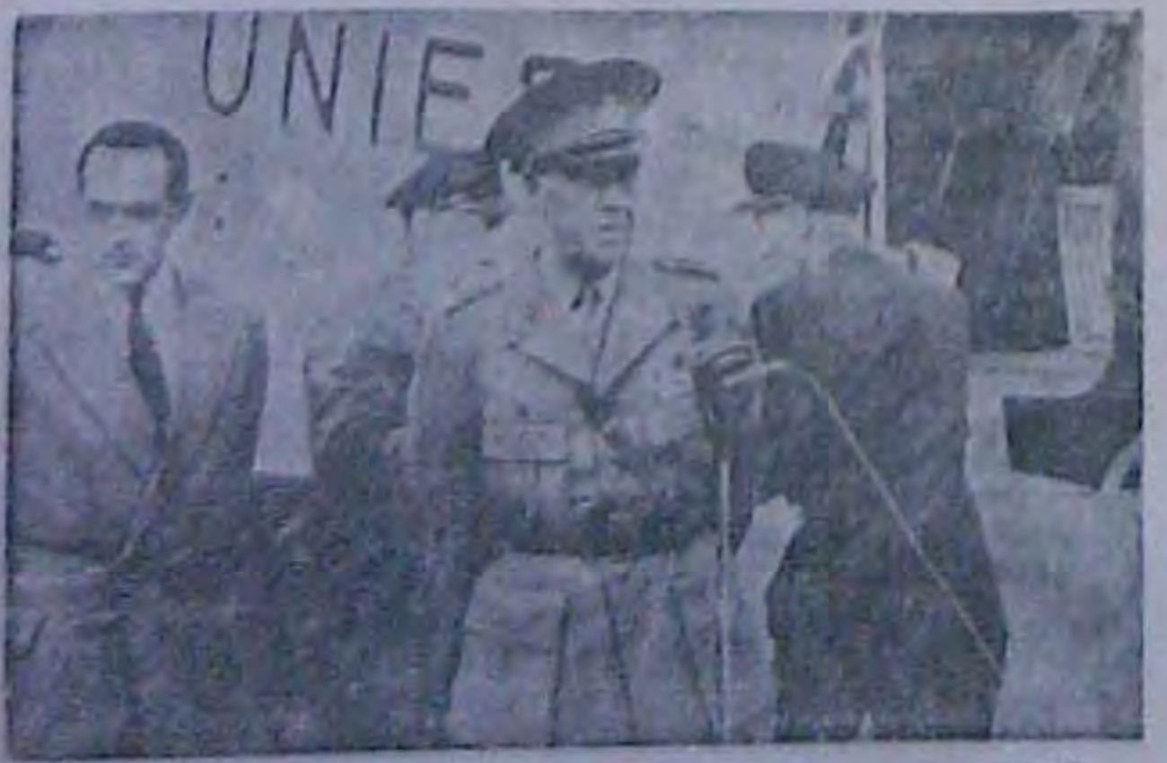
Bosspeands Off y Therefore theth I. Bennamer.

ПАРИЖ (ББС), 8 червил. Сьогодиі францулький вабінет схвадин рекомендамі доплоненної конференції. В п'игвидю їх розгладатилуть Національні Збори. Гадають, що дебата будуть