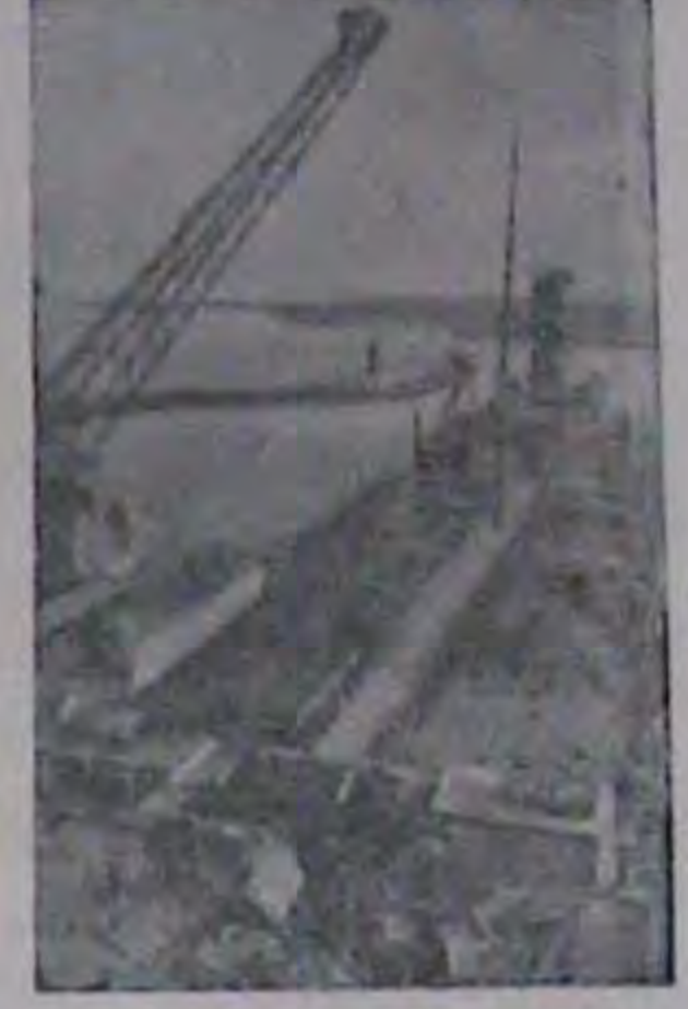
Украіна нал морем. Опескуні док.

🗌 Делегація від Об'єднанни Інвалідів у Вімеччині мала авдиенцію в епископа Кир Бучка та передала меморандум до Папського Пре-Щодо клінату, то не не так страш- З українським привітом Іван Пот- столу и справі опіки над інвалідами і переселения іх в інші праїнц.