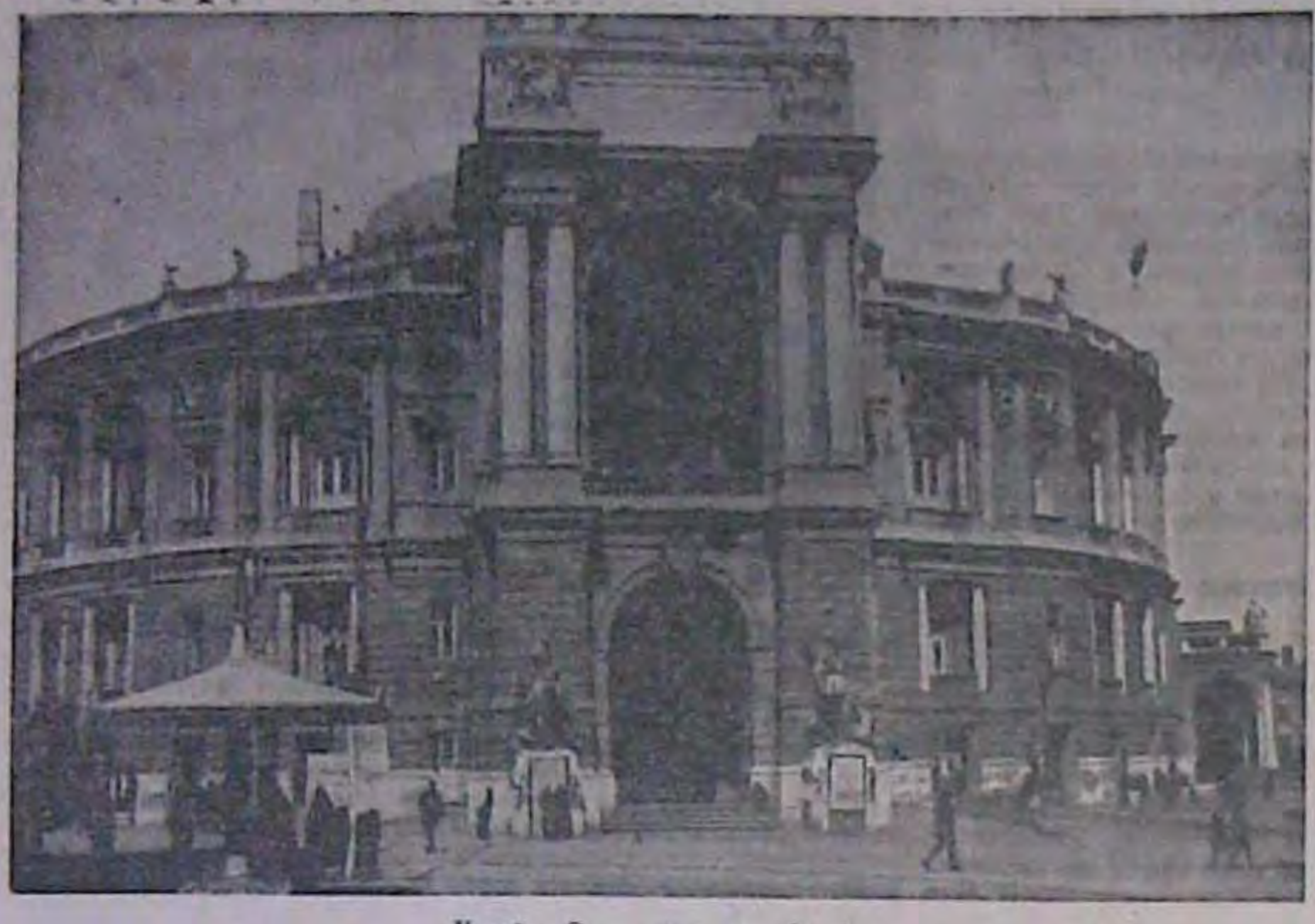
Україна. Оперовий театр в Одесі.