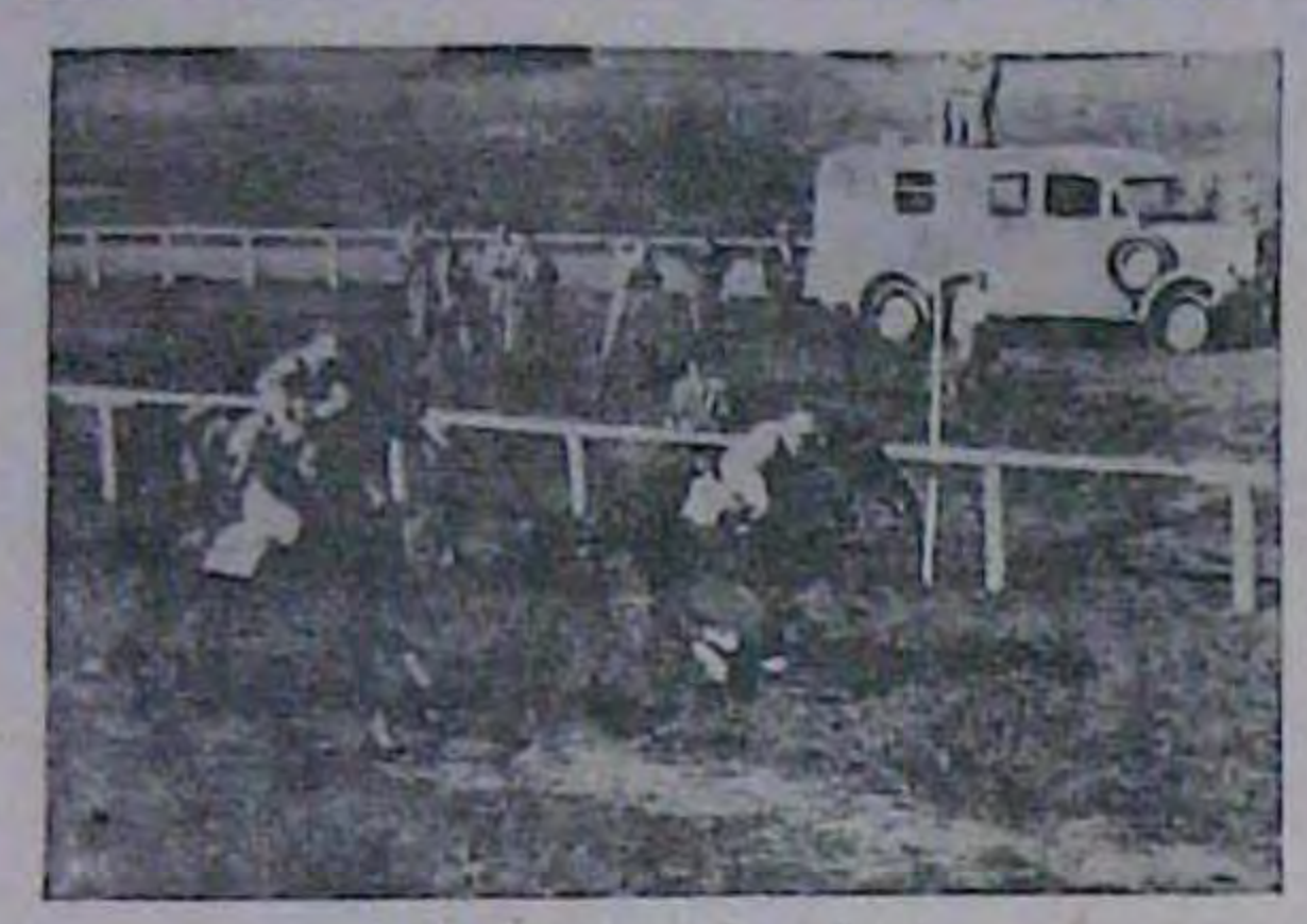
На перегонах у Франкфурті