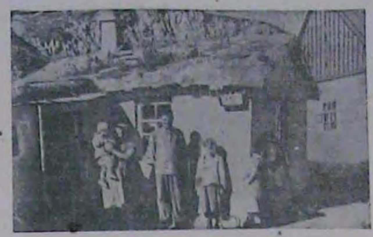
Колгоси на Україлі. Колгосина родина біля свого будинку.

Ми знаемо, що наш успіх неминуче привів би до поразки фанизтимчасові військові успіки. Я йлу і від напроналістичними колами зок- клу треба знашити.