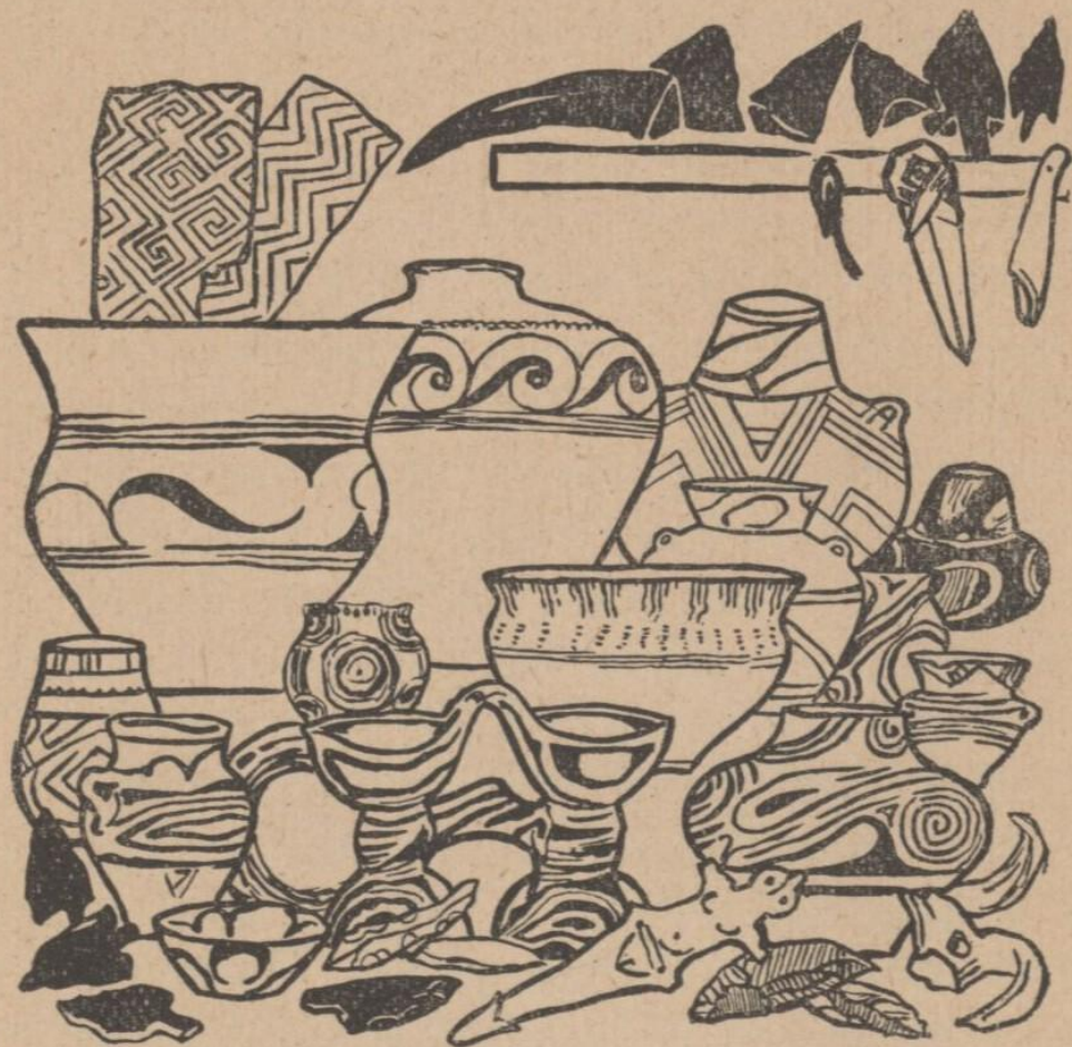
Знаряддя камінної доби з терену України.

мали ніякої, або обпиналися листями та шкурами звірячими 1) . Шили одяжу тую риб'ячими кістками або камінними шилами. Де далі почали вже люде виробляти собі різні