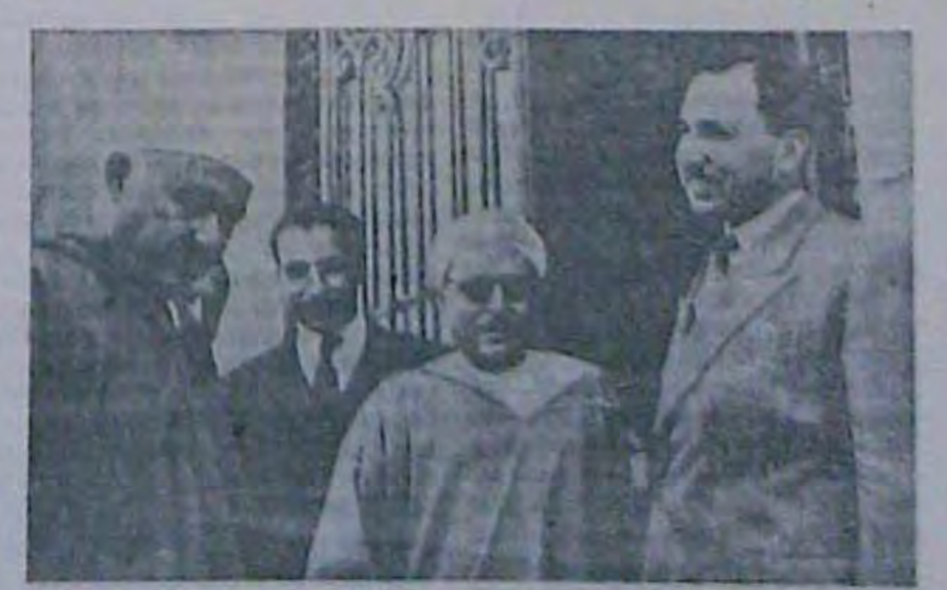
Абд едь Крім (перший заіва) продовує свої послуги для справа визполнице

Зпільнення Лейня — пе, безупонно. відчутний удар по комувіствина парті Фінтандії та її агентурній диальност на корветь Москви Эпино в советсько АНКАРА (Наф). В Істанбуді при- фінським пактом, Совети зобов'яза A. POMALIKO