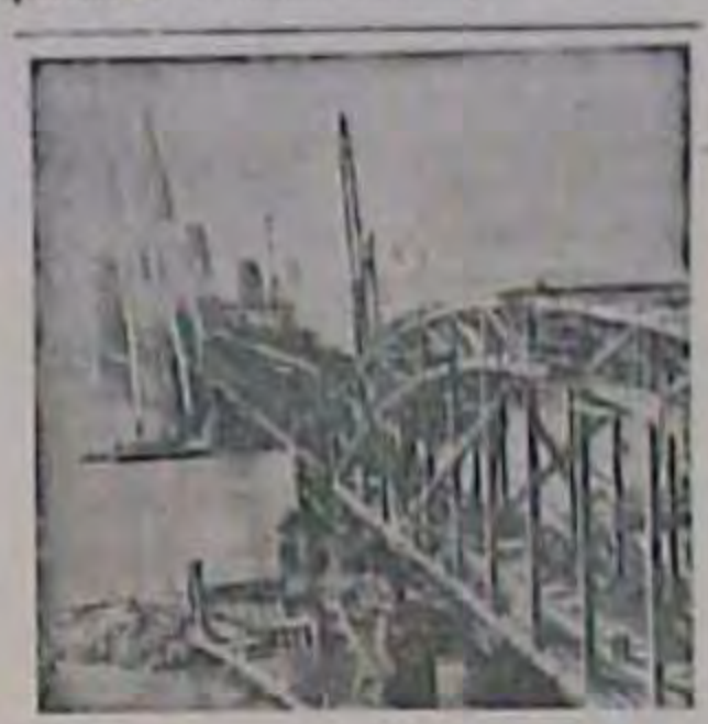
Кельневана міст через Райн відбу довано ( lens!

МЮНХЕН (Дена). З пагоди прогодокої політики, то її провадить амери- тення держави Ізраїть в Нівенькому блікованому советською пресовню аген- дівських об'єднань амераканської зони. лася косовиня сіна. пісю ТАСС, говориться, що автор листа В разках урочистостей оголошено про оборони Палестини.