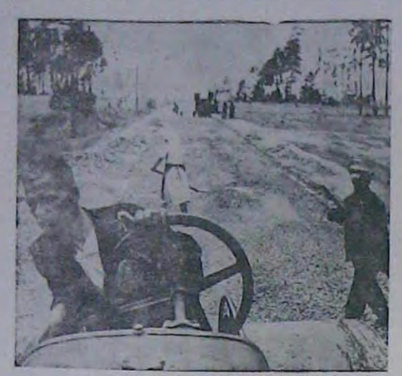
гарилски сельни вигнаці на будивнитво дору-