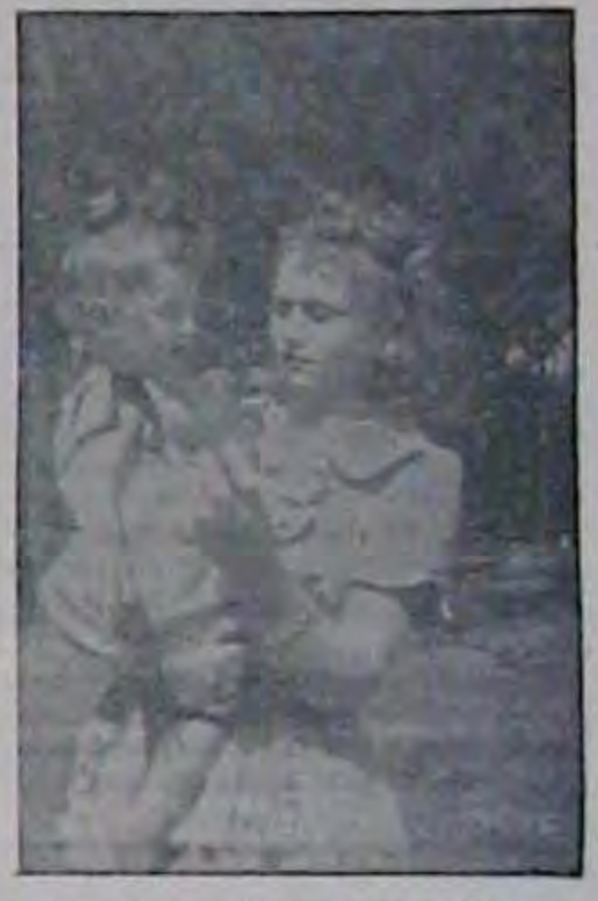
Управиська постеса Гания Чер нь в донечкою