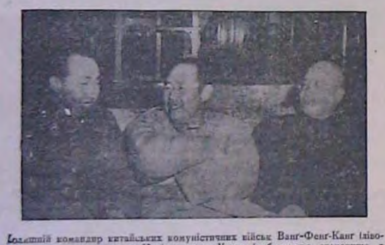
руч) перейшов на сторону Напіонального Уряду і обговорює становище з чаниваром напіональних китайських військ у північному Китаї генералом ДЕНА-НІТ-Білас Фу-Тсо-ей (в середний).