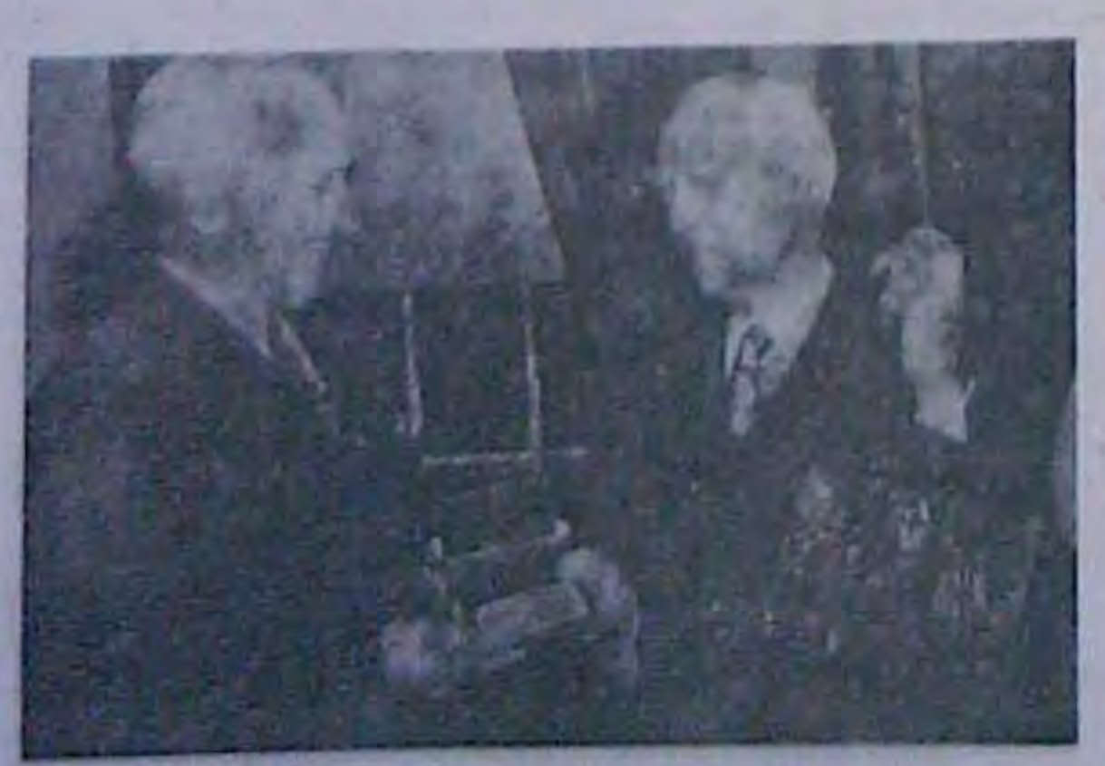
Презнакот Трумки знаний, или (прим, ик прихначания анариканського нистопального спорту бивоболу. На фило: Трумов плержуе волоту членську виховку бейсболського клюбу (Henn HII) L CHOSTOFFORL

Спостерігачі одностайно занилиють, що ноти містить у собі таку ясно висловлену пропозицію: обмежения