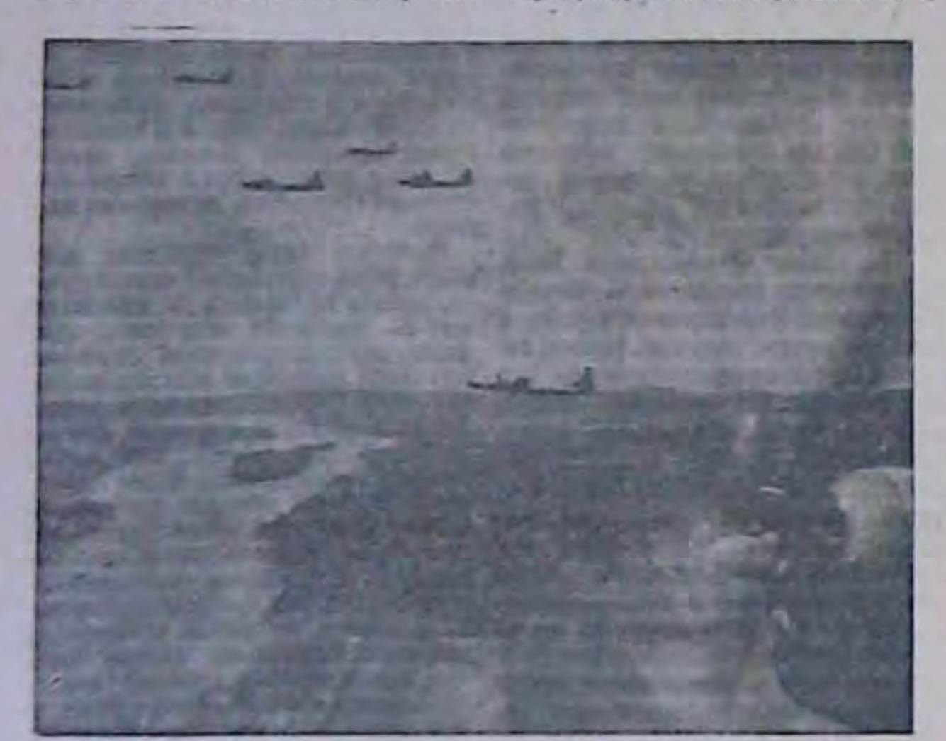
Америванські суперфортені над Райном. (Дена)

СЕОЛ (ЮП). 14 трания. Комуністичдатав здобуде безпартійні нандидати ней уряд Памічної Кореї пілком припинив постачания струму до Південної