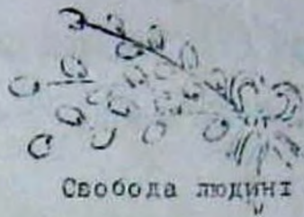
Свобода людині !