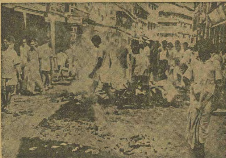
Заворушення в Бомбеї. Збуджені смертю Ганді маси напали на урядову установу організації Магасаба, викинувши на вулицю й спаливши внутрішні устаткування.

ЧАРЛЗТОН (НДФ). 16 березня. В своїй промові з нагоди 105-річчя заснування військової школи в Чарлзтоні Бернс сказав: через чотири-п'ять тижнів міжнародна ситуація може так змінитись, що США багатимуть армію в військовому однострої, а не лише на папері. Бернс обстоював думку, що США не підготовані до світової кризи.