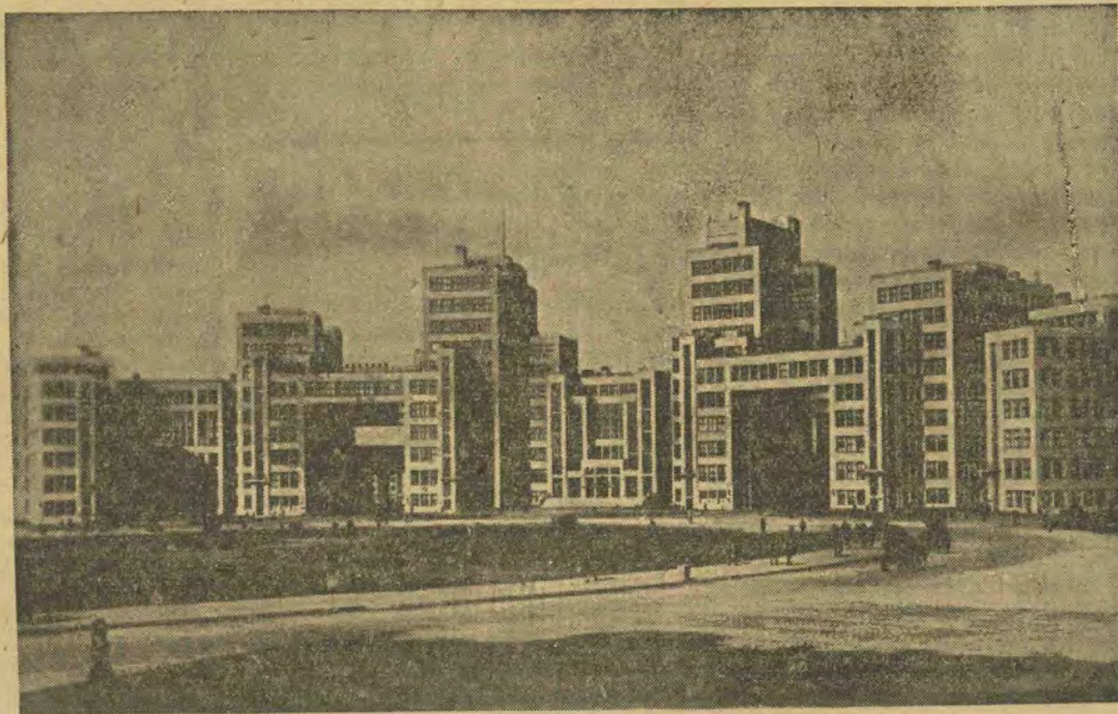
Будинок Держпрому в Харкові, що був зруйнований совєтськими під час вступу 1941 р.

„конкурентів“, увірвалися у Львів і, сповнені радисних надій, „проголосили“ урочисто українську державу? Чи розуміли це і ті досвідчені „старші“, які вже в періоді поразки і остаточної приреченості Німеччини набували акції чужого корабля, що йшов уже на дно в грандіозній катастрофі? Україна об'єктивно і цей раз була серед тих сил світу, які не були прямими партнерами в грі і які становлять ту „третю силу“, яку хоче оформити сьогодні і Західня Європа, і поневолені нації світу. Опього розуміння України, як першорядного чинника третьої сили, який діє активно у війні і революції, починаючи з 1917 року, не було в Галичині.