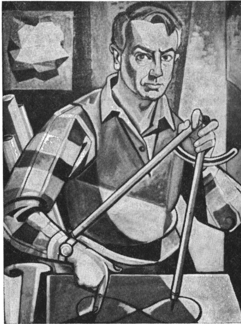
С. Гординський — Я і безконечність (олія)

Варто підкреслити, що особливо вихідці із Наддніпрянської України мали нагоду найдокладніше познайомитися з поетичним надбанням С. Гординського лише за десятою збіркою поета під назвою Вибрані поезії , яка вийшла в Кракові 1944 року. Саме на базі цієї збірки у багатьох і склалося, мабуть, цілком слушне переконання щодо "питоменної неокласичності" його образних побудов.