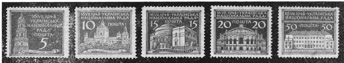
1. Обігова серія з нагоди відкриття I-ої Сесії УНРади