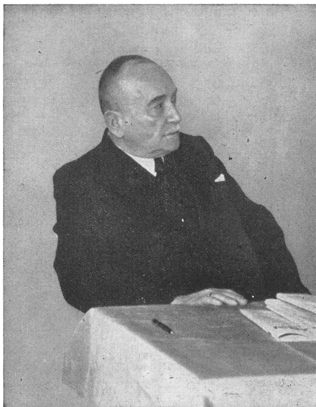
Президент Української Народньої Республіки Д-р Степан Витвицький