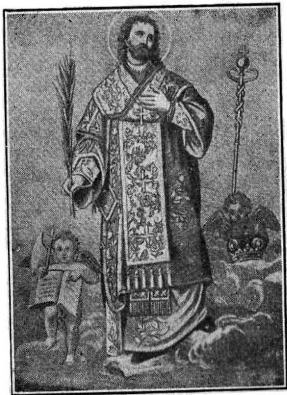
Св. єщмч. Йосафат Кунцевич, що віддав життя за святу Єдність.