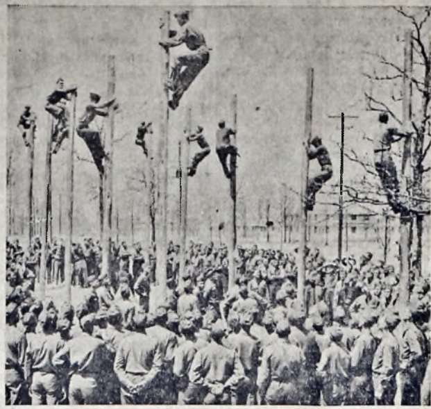
While buddies gathered round to watch and learn, members of the Fifty-eighth Signal Battalion at Camp Forrest, Tenn., show off their pole-climbing prowess in exercises designed to school men in the fine art of field communications. In actual warfare, soldiers of signal corps must be adept at tree-climbing. Climbing irons are used.

ми старих і молодих, що парами, трійками, колесом і в поодинокую танцюють якогось індіанського "аркана", що місцями дуже нагадує гуцульський "данець".