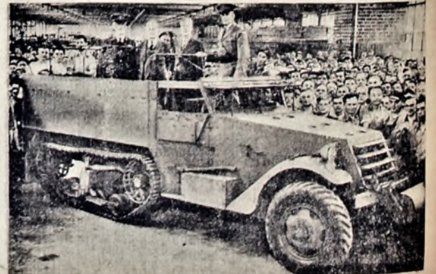
Новий рід троків, призначених для транспорту війська. Військові знавці оглядають в Шикаго першу машину того роду.