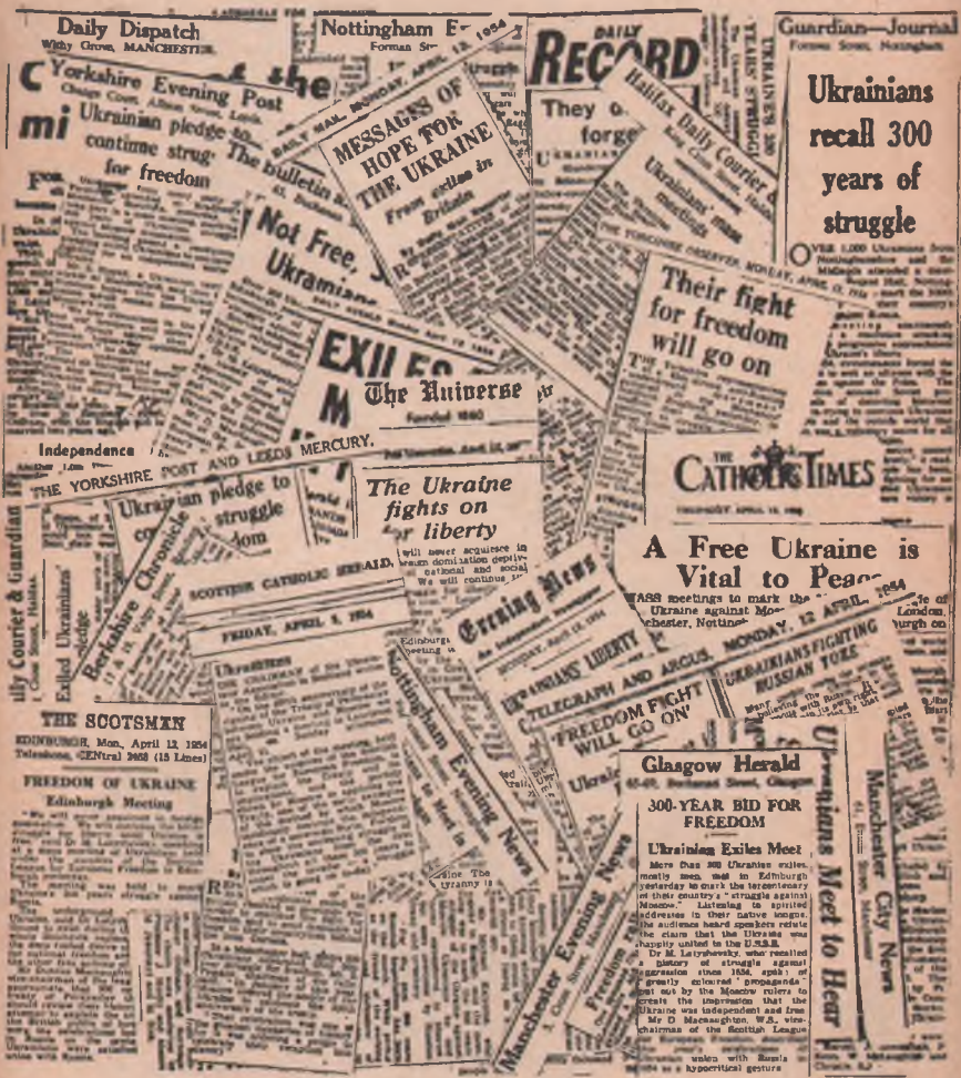
Вирізки (монтаж) з британських газет про визвольну боротьбу України.