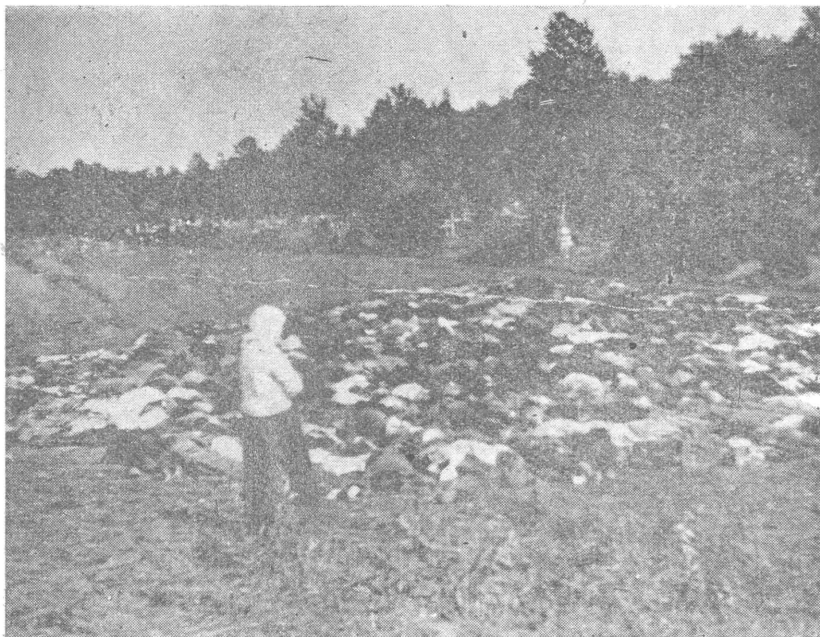
Замордовані більшевиками українці під м. Тарнополем (Зах. Укр.). Липень 1941 року.

Бочка знову оточена юрбою жінок. Галас, сварка, бійка..