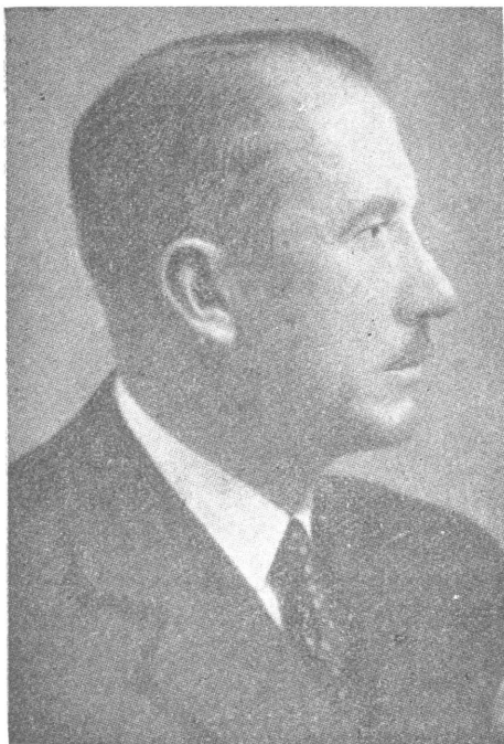
ЄВГЕН КОНОВАЛЕЦЬ (1891 — 1938)

22 січня 1919 р. — формальну державну злуку, антисо-борницькі прояви не перевелися в психології українського народу, вони тривали й діяли далі, не тільки у