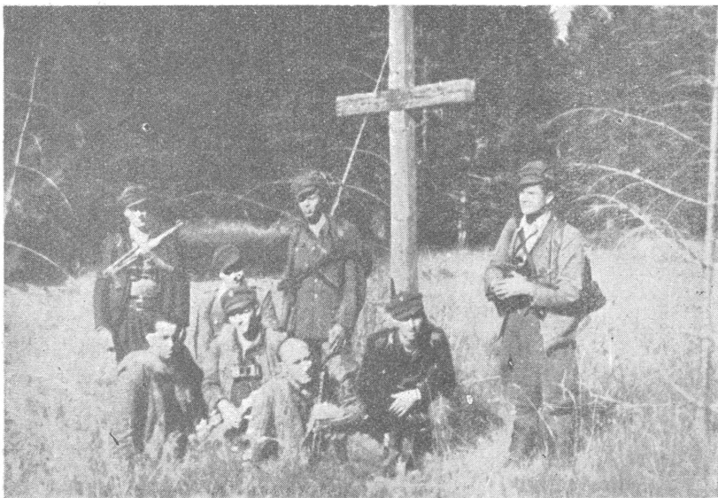
Провідник ОУН Лемківщини із своїми працівниками під час перевірки терену. Весна 1947 року, повіт Сянік.

В східній Лемківщині на протязі цього часу (поза частиною Римаівщини) охотників до виїзду поза окремими випадками (кацапи, комуністи) майже не було. Протинно, населення цих теренів поставило гідну відсіч всяким большевицько-польським агітаторам і виселенчим комісіям.