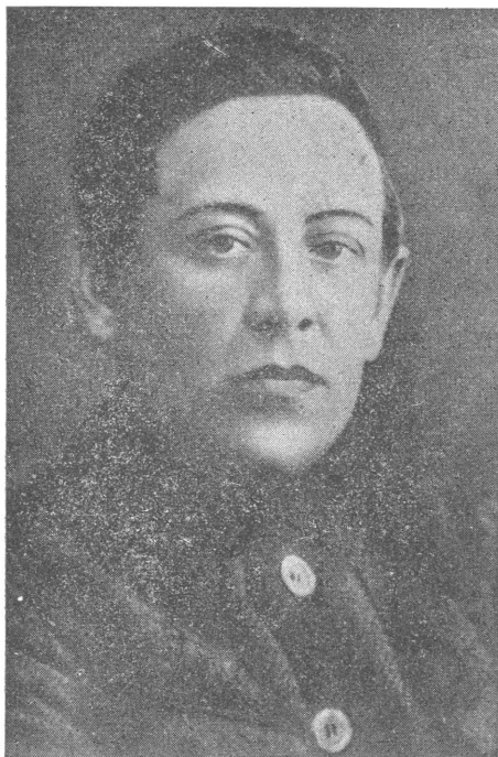
СИМОН ПЕТЛЮРА (22. 5. 1879 — 25. 5. 1926)

„В українську державність ми віруємо, українську державність ми ісповідуємо, в її неминучості ми переконані“ — писав він в одній своїй газетній статті.