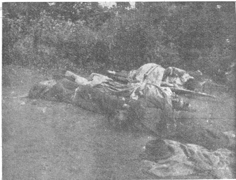
Замордовані большевиками українці в м. Помор'ях (Зах. Україна). Липень 1941 року.