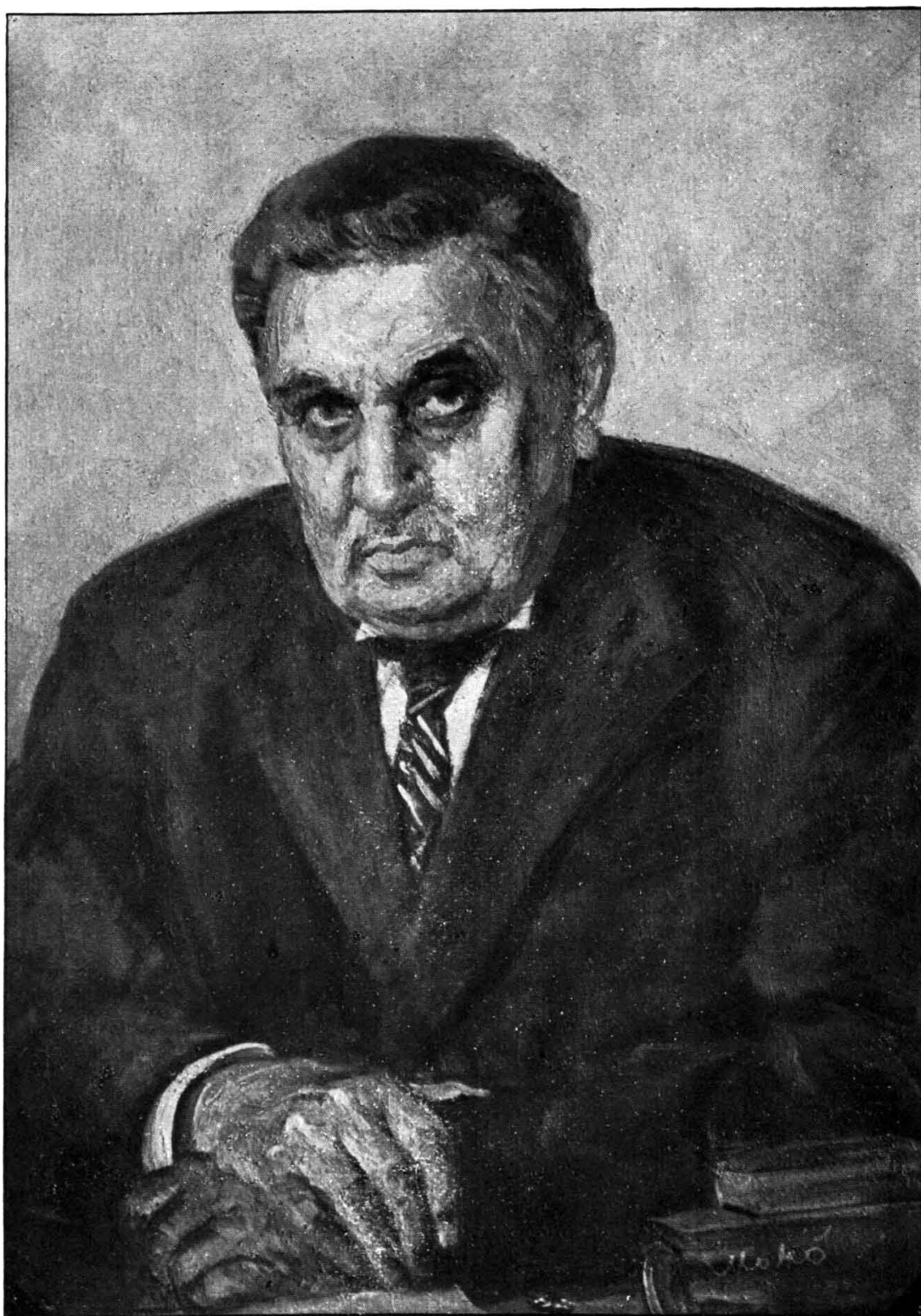
Ф. А. ЩЕРБИНА.