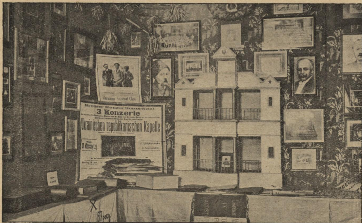
Матеріали до артистичних виступів за кордоном.

Третій відділ — емігрантський — збирає матеріали до життя та діяльності української політичної еміграції по різних країнах Європи, Америки, Африки та Азії. В цьому відділі, крім архівних матеріалів, що вже тепер мають не-аби-яку історичну цінність, особливо визначаються матеріали до політичної роботи української еміграції, а ще більше зібрано матеріалів для характеристики культурної, наукової та мистецької праці українських емігрантів. Сюди входять архіви поодиноких політичних партій, українських установ, що після ліквідації передавали своє майно до Музею, архівні матеріали поодиноких людей, що передавали й передають їх за заповітом і т. д. Так само тут треба зазначити велику колекцію невидрукованих рукописів різних діячів, письменників і т. д., почасти вже покійних, які можна було б уже негайно використовувати для друку. Показними та імпозантними виходять колекції мистецької творчості українських артистів за кордоном, тво-