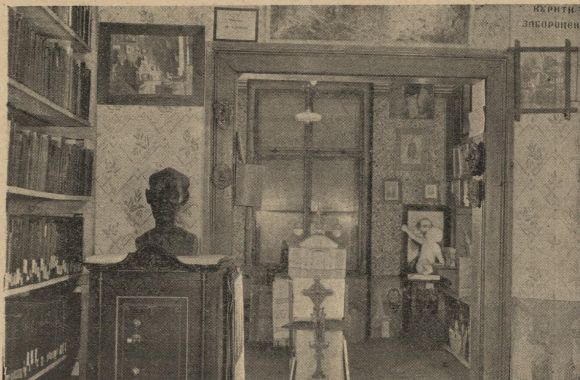
Вхід до Музею. Бібліотеки та збірки українських часописів.

бою Музею є приміщення, яке для вже зібраного матеріалу мало би бути 10 разів більше, ніж є тепер; та ще ж треба вважити невідомий постійний зріст музейних збірок, вплив яких, на щастя, не спиняється, а навпаки — зростає!