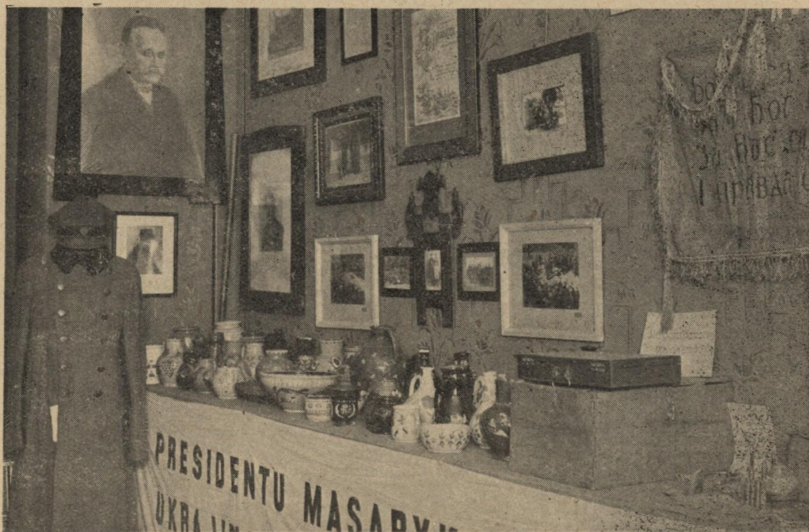
Військовий відділ. Уніформи українських старшин. Порцеляна роботи полонених в Раштадті.

Характер музейних річей від самого початку надиктував розподіл музейних колекцій на чотири відділи: 1) дипломатичний, 2) військовий, 3) емігрантський, 4) всього іншого. Такий розподіл виявився досить відповідним і виправдався практикою дальшого зросту музейних матеріалів. Правда, перший відділ, що на початку особливо енергійно розгортався тим, що до Музею входили архіви різних дипломатичних місій Української Народної Республіки, Української Держави й Західної Української Народної Республіки, через рік у своєму розрості спинився і тільки зрідка доповнюється окремими вкладками; так, 1931 року заходами Українського Наукового Інституту в Берліні урятовано й передано до Музею ще цінний архів української дипломатичної місії у Фінляндії.