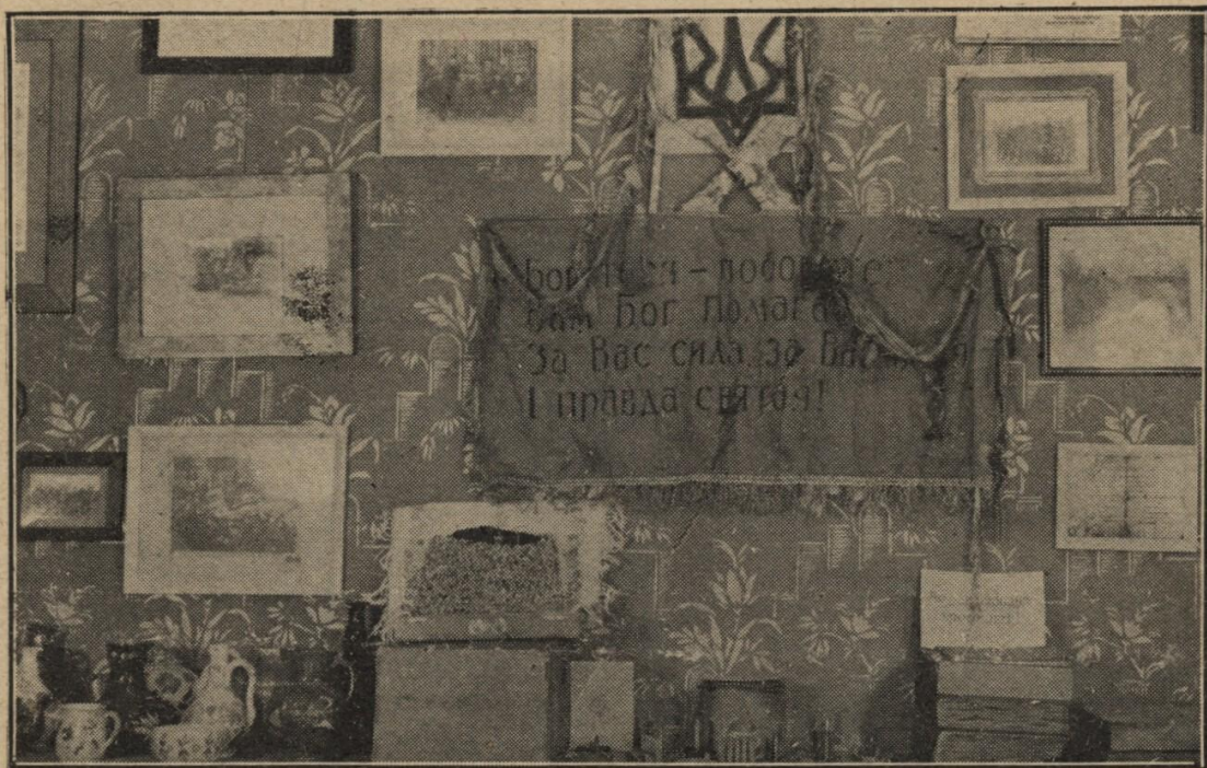
Військовий відділ. В центрі прапор кінно-гарматного полку, у боях пошматований.

Музей Визвольної Боротьби України, зложений у Празі 1925 року, за 7 років свого існування й діяльності розвинувся до великої й багатой на музейні та архівні матеріали установи всеукраїнського значіння.