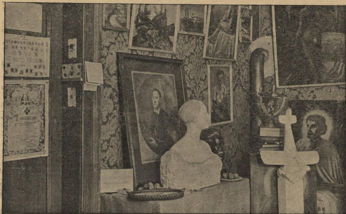
Скульптура С. Колядинського (1893—1926) та олійні образи мистців за кордоном.

У зв'язку з першими трьома відділами Музей зібрав тисячі негативів та фотографій, що фіксують дипломатичний, військовий, артистичний та культурний побут і працю українців, здебільшого, за кордоном. Крім цього, Музей має кілька десятків бібліотек різних військових та культурних і наукових організацій, які зберігаються в Музеї не розрізнено, а як бібліотеки тих установ, що їх зібрали, що не перешкоджає в Музеї тими книгами користуватися.