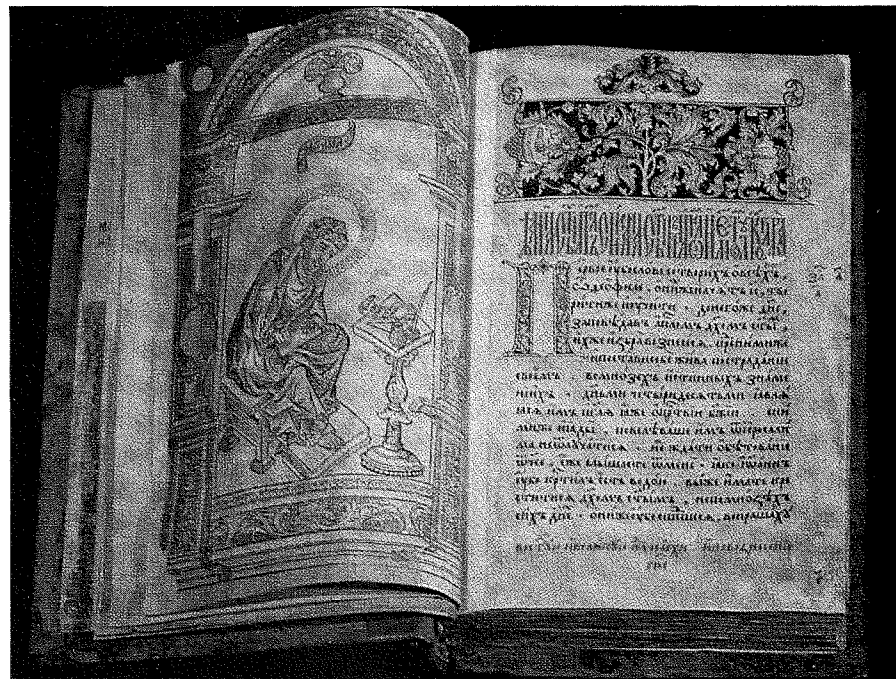
„Апостол” 1564 року.

підручник слов'янської мови, в якому багато місця відводилось вихованню молоді в патріотичному дусі. Палким заклик до поневоленого народу прозвучали тут слова Федорова: „Духа не угашайте... утешайте малодушних...”