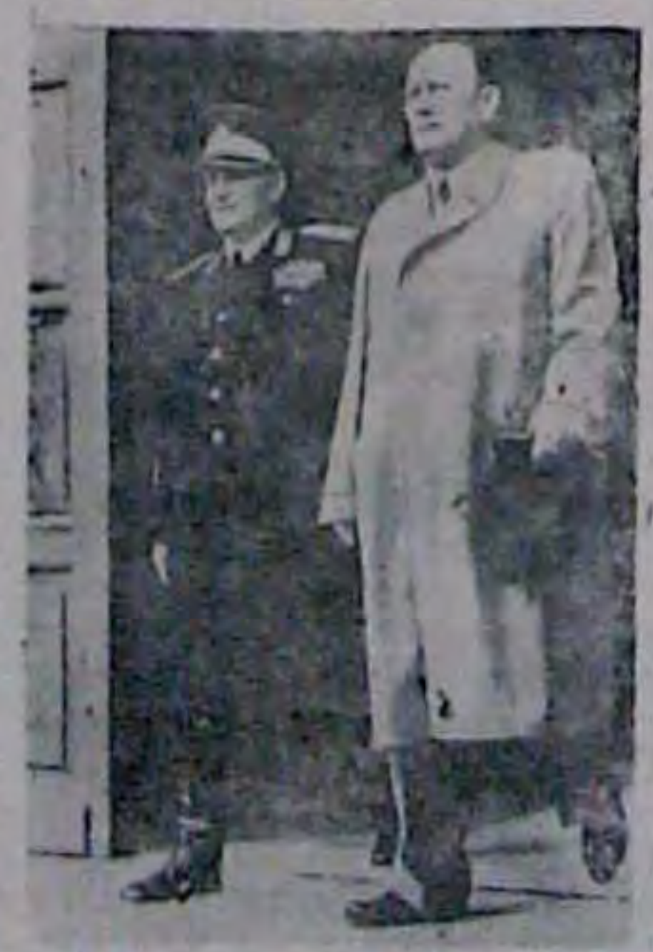
Міністер-пре шденти Югославії Boarapile Tiro (saina) ( Histron.

кінці минулого тижня міністер-пре- мільярдів лір на підтримку безро-