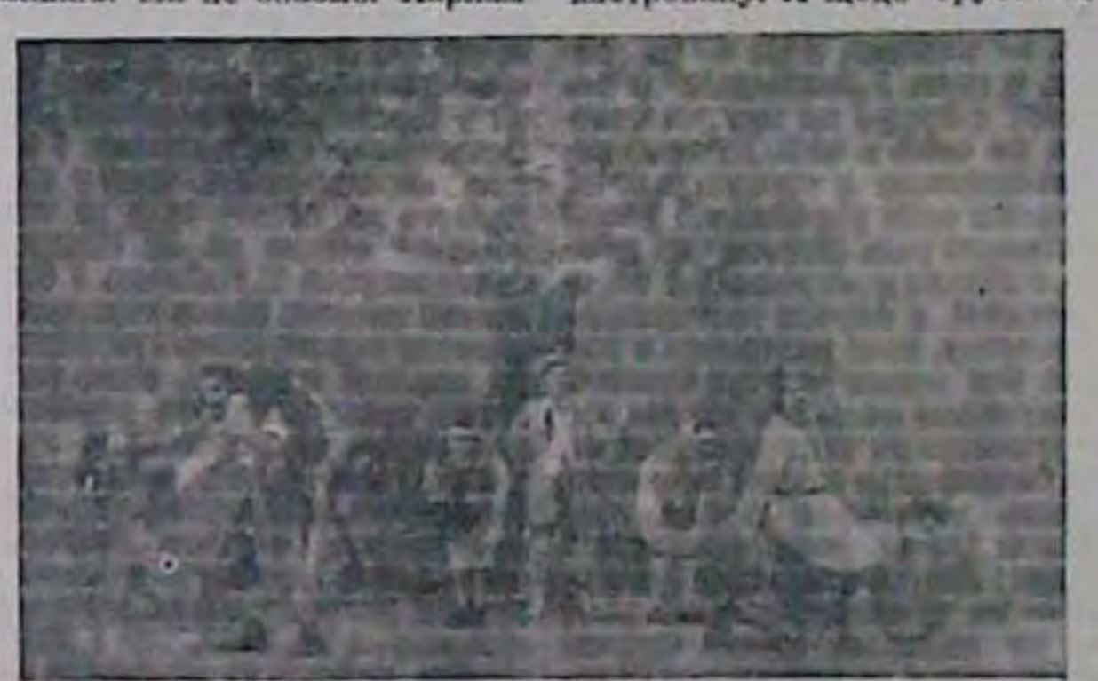
Спена в другої дії комедії "Пошилися у дурві" в постановці драмі Студії И. Гірпяка.

Кололітературних ґомункулів аж пересминуватаме від Осьмаччиних хрьопнути, клациути, рецати, луснути і т. под "Моралістів" виведуть в рівноваги Осьмаччині еротичи сцени - прекрасні і сповневі жаття і адоров'я, як чудесні прийняла? Ми не внаємо: Харлам- кастровану. А щодо грубости, то