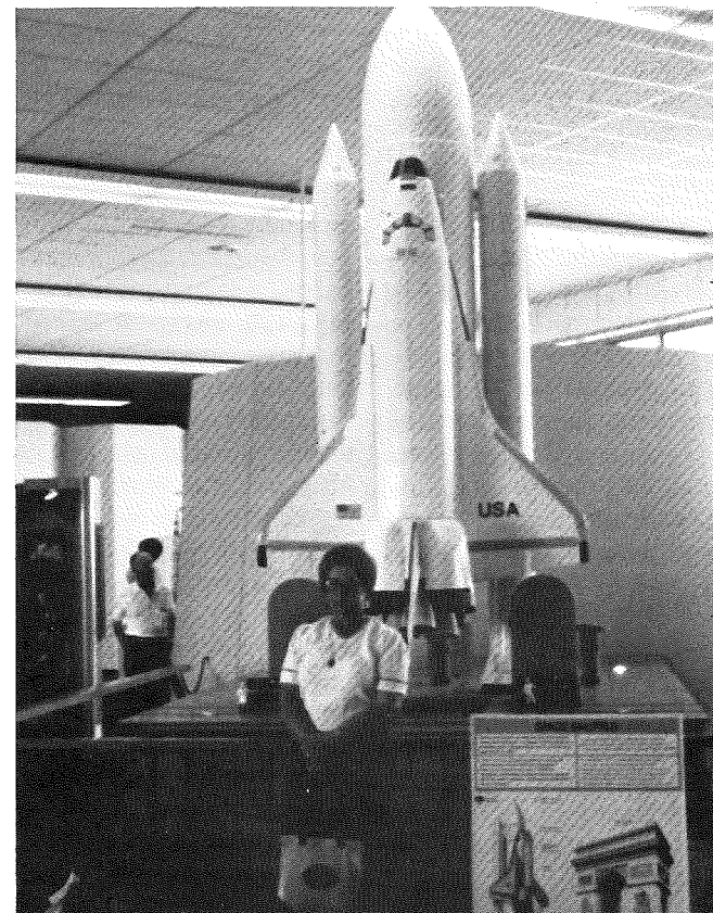
1. Приземлення “Колумбії”. 2. Біла моделі.