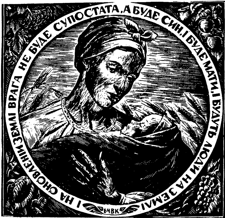
Лінограф В. Киткіна, 1964, до 150-річчя народження Т. Шевченка

І на оновленій землі Врага не буде супостата,