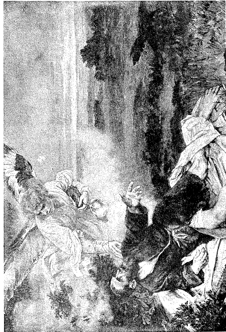
З'явлення ангела пророку Іллі.

Якби всі християни прийняли науку Біблії про ангелів, я переконаний, це послужило б великою підтримкою, радістю і безпекою для всіх нас у цьому критичному періоді нашої історії. Віра в існування ангелів іде поруч з вірою в правдивість Біблії, бо ж Біблія повна вірогідних відомо-