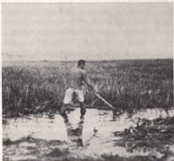
Косовиця сіна в болотах біля Прип'яті. (За “Polish Countrysides”).

В році 983 київський князь Володимир Великий відбув виправу на Ятв'ягів, очевидно використовуючи водний шлях Прип'ять-Ясельда-Щара і Німан. В році 1038 великий київський князь Ярослав Мудрий знову в поході на Ятв'ягів, правдоподібно використовуючи цей самий шлях. Виправи князя Ярослава повторюються в роках 1040 і 1044,