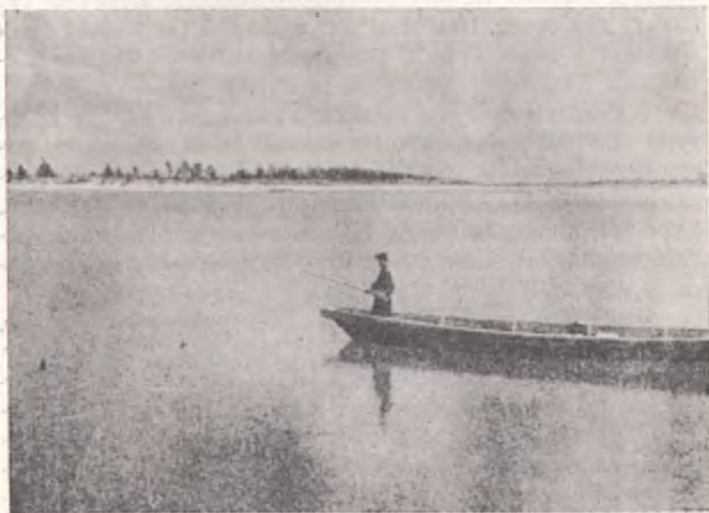
Річка Прип'ять у нижній течії. (За О. Маринич)

З кінцем періоду йолдія, коли ледівець відсунувся на Скандинавський півострів, на терені Полісся розвиваються мезолітичні культури, творцями яких були народи, що правдоподібно прийшли з полудневого заходу. До сукупності промислів, що в той час розвинулися на Полісся, належали вироби тарденуазької культури. Кремінне знаряддя, що належить до виробу народів цієї культури, виступає на надмах середнього Бугу і надприп'ятського