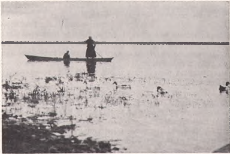
Ріка Ясельда біля Городища на Поліссю (За "Polish Countrysides").

Зібраний автором топономастичний матеріал відноситься до дуже різних періодів історії цього краю так історичних, як і передісторичних.