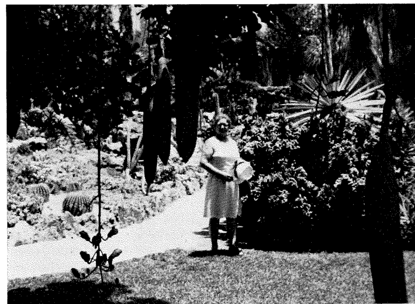
Біля ковбасного дерева у Джунглях Папуг у Флориді.