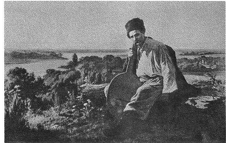
К. О. Трутовський

Т. Г. Шевченко з кобзою над Дніпром. 1875.