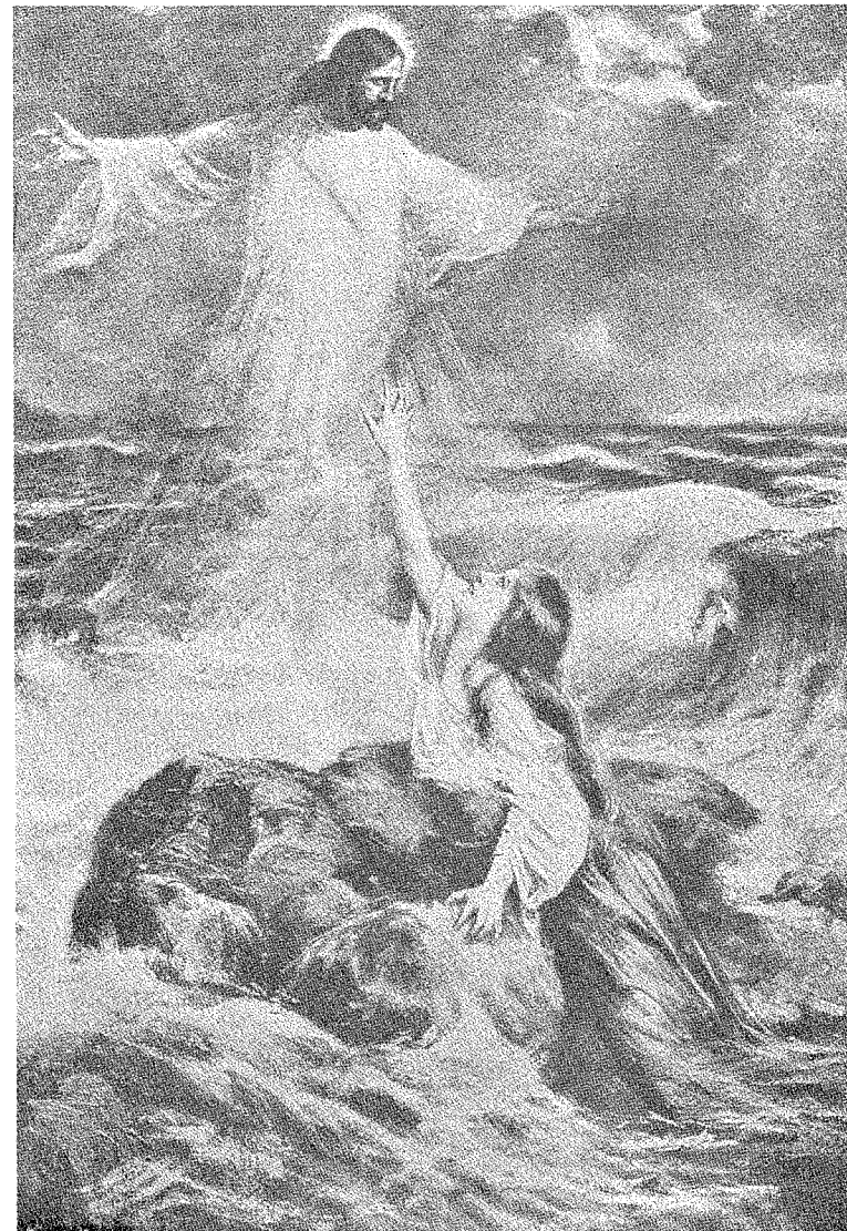
“Він може й випробовуваним допомогти” (Євр. 2:18).

Обітниця блаженства для всіх, хто зберігає пророчі слова, є повторена при кінці кн. Об’явлення 22:7, де читаємо: “Блаженний, хто зберігає пророчі слова цієї книги”. Дехто міг би подумати, що ця обітниця відноситься виключно до кн. Об’явлення, але пророча вістка тієї книги дуже щільно поєднана з усіма пророцтвами Старого та Нового Заповітів, тому вона мусить відноситися до всього пророцтва Біблії. Марія, мати Ісуса, є для нас ду-