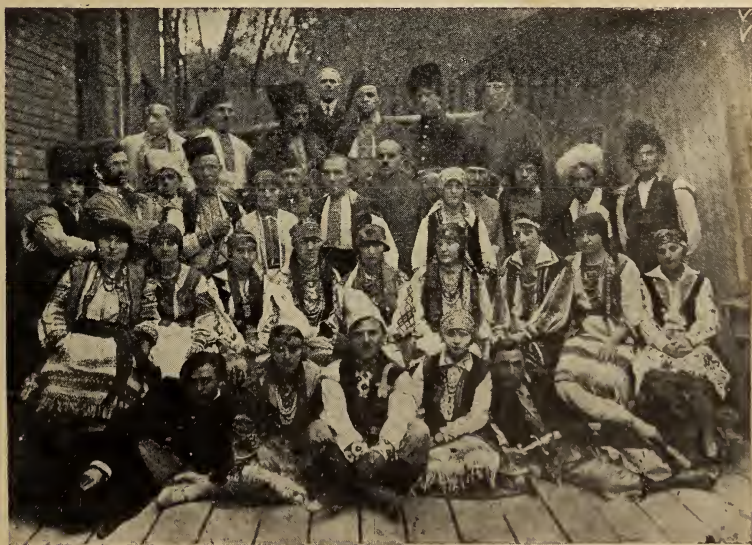
Аматорський гурток при філії «Просвіта» в Кракові після виставки «Назар Стодоля» 1928 р.