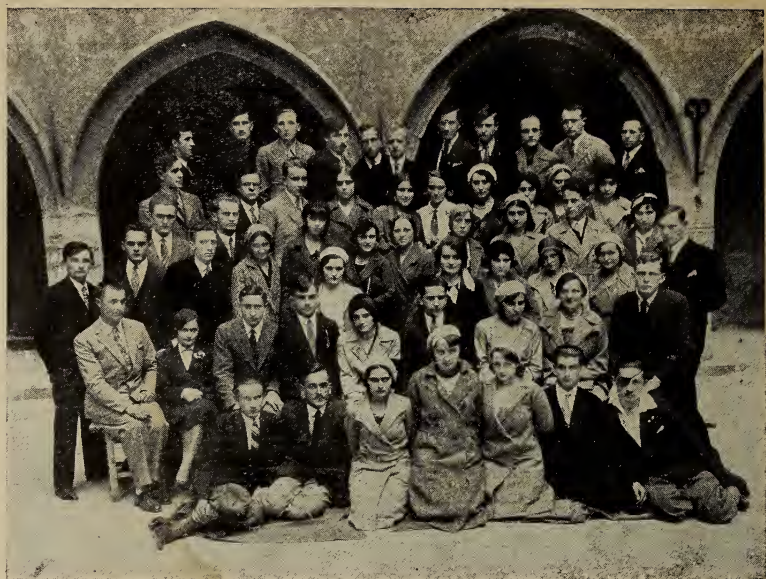
Пластова секція при «У. С. Г.» (1930).