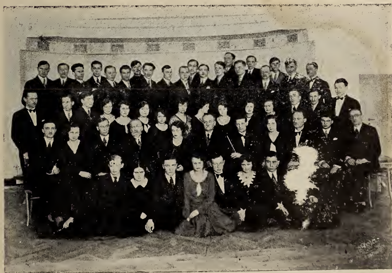
Члени Хору «У. С. Громади» після Шевченківського Свята в дні 15. III. 1931 р. В середині представники краківського громадянства з проф. Б. Лепким на чолі,