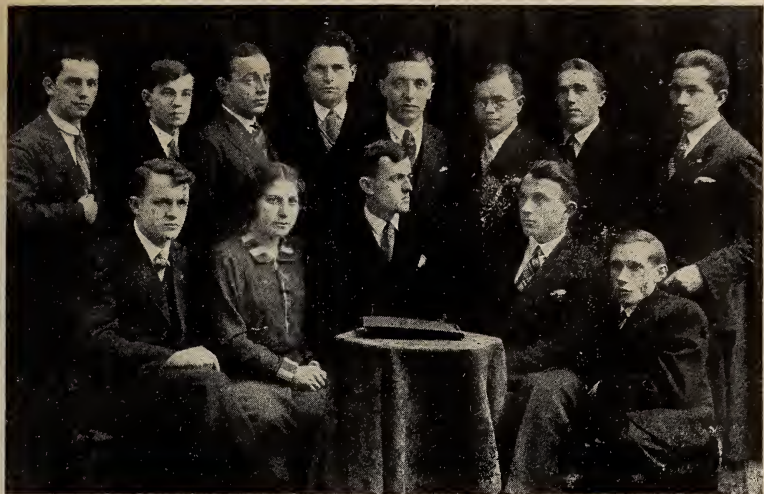
Виділ та представники Суду Чести і Контрольної Комісії У. С. Громади в шк. р. 1930/31,