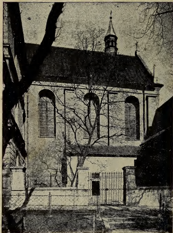
Парох. Церква св. Норберта в Кракові (вид від сторони плянт).