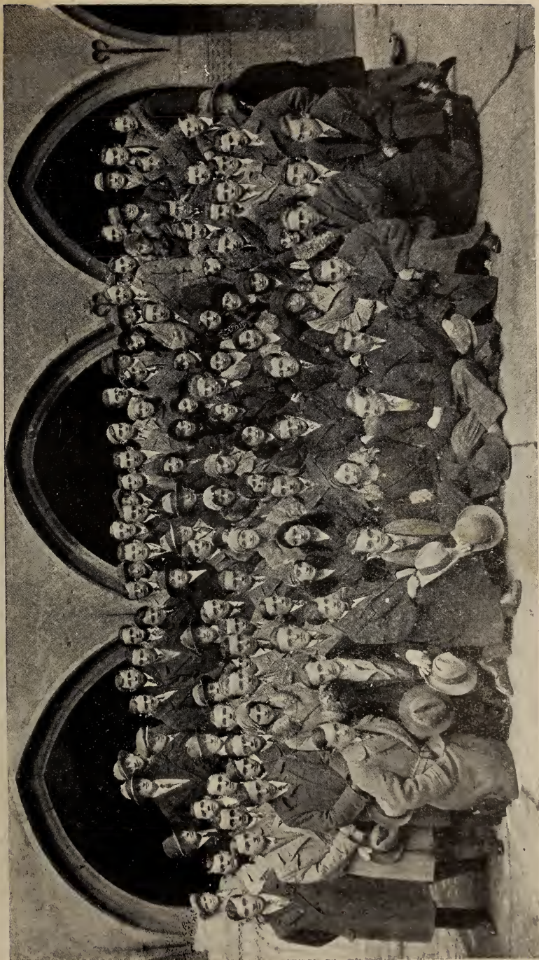
Т-во Укр. Студентська Громада в Кракові в 1930 р. (Знімка зроблена під колючками старого Університету).