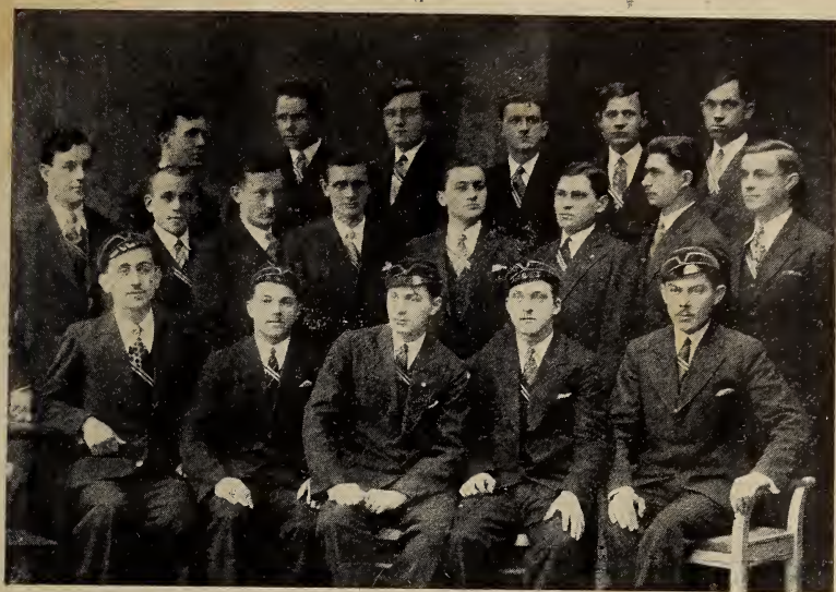
Укр. корпорація «Хортиця» (1931).