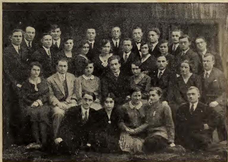
Педагогічна секція при «У. С. Г.» (1931).