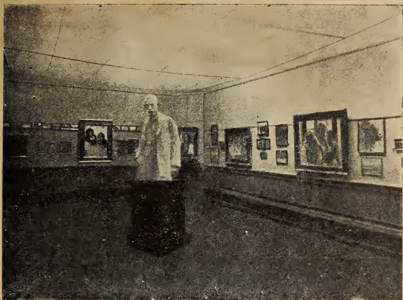
Збірна виставка праць Олекси Новаківського в краківській палаті мистецтв 1911 р