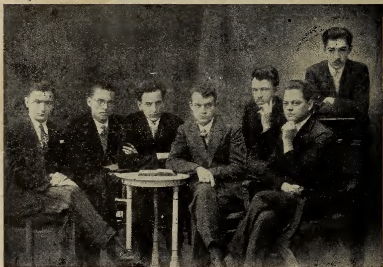
Літерат-мистецький гурток «Ладом» (1930).