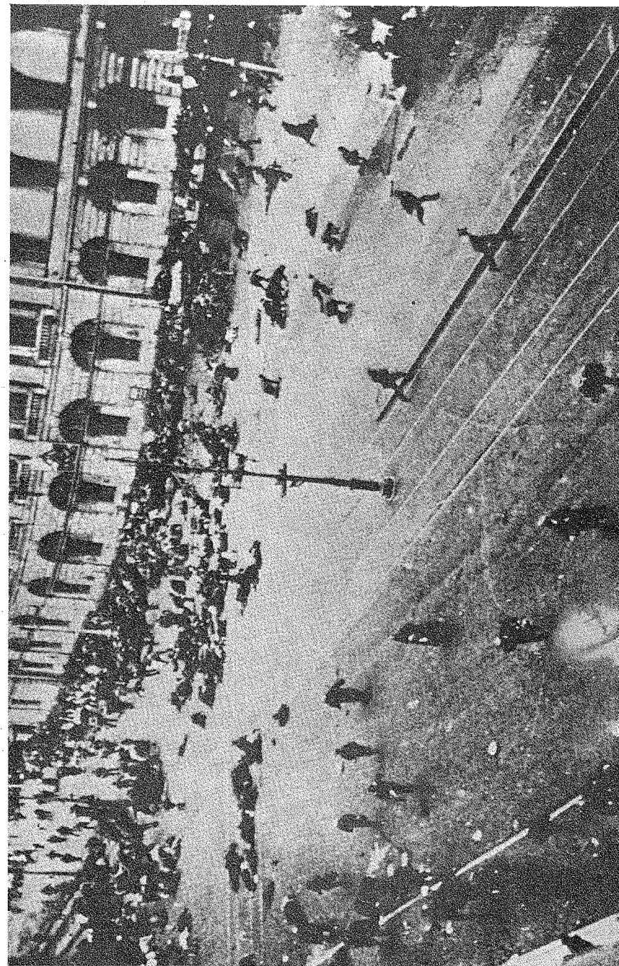
Кронштадтські матроси-революціонери стріляють по населенню Петрограда 17 липня 1917 р. А в березні 1921 р. повстали проти більшовиків.

У справі випадку в Шуї, що про нього вже було говорено в Політбюро, я вважаю необхідним прийняти тверде рішення негай-