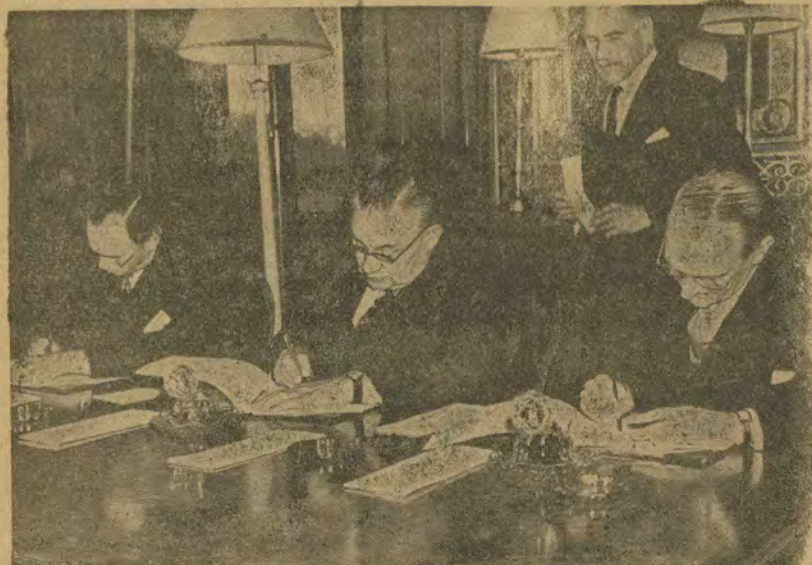
У Лондоні підписано протокол про повернення Італії золотого запасу відбитого союзними військами від німців. На фото: Валдман (США), Бевін (Англія) й Мігоне (Італія) підписують протокол.