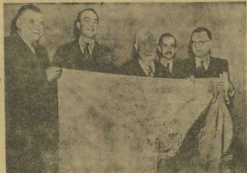
Прапор Об'єднаних Націй — в центрі блакитного полотна знак ООН — схвалено на сесії ООН в Лейк Сакселі.

ПАРИЖ (Радіо-Мюнхен). 27 жовтня. Згідно з неостаточними підрахунками, під час останніх других вчорашніх ви- борів до місцевих самоуправ (у гро- мадах до 9.000 мешканців) на перше місце вийшла партія радикал-соціалі- стів Ерріо. На другому місці—соціалі- сти. Комуністи здобули четверте місце, а партія де Голя лише п'яте.