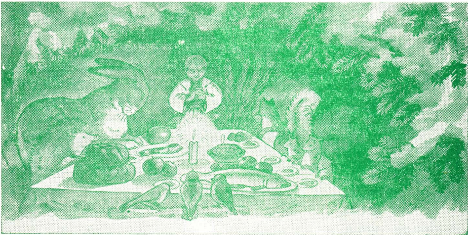
Свят-Вечір у лісі

І в степ України Різдвяним привітом Привіяв під вікна, Що мокрі від сліз.