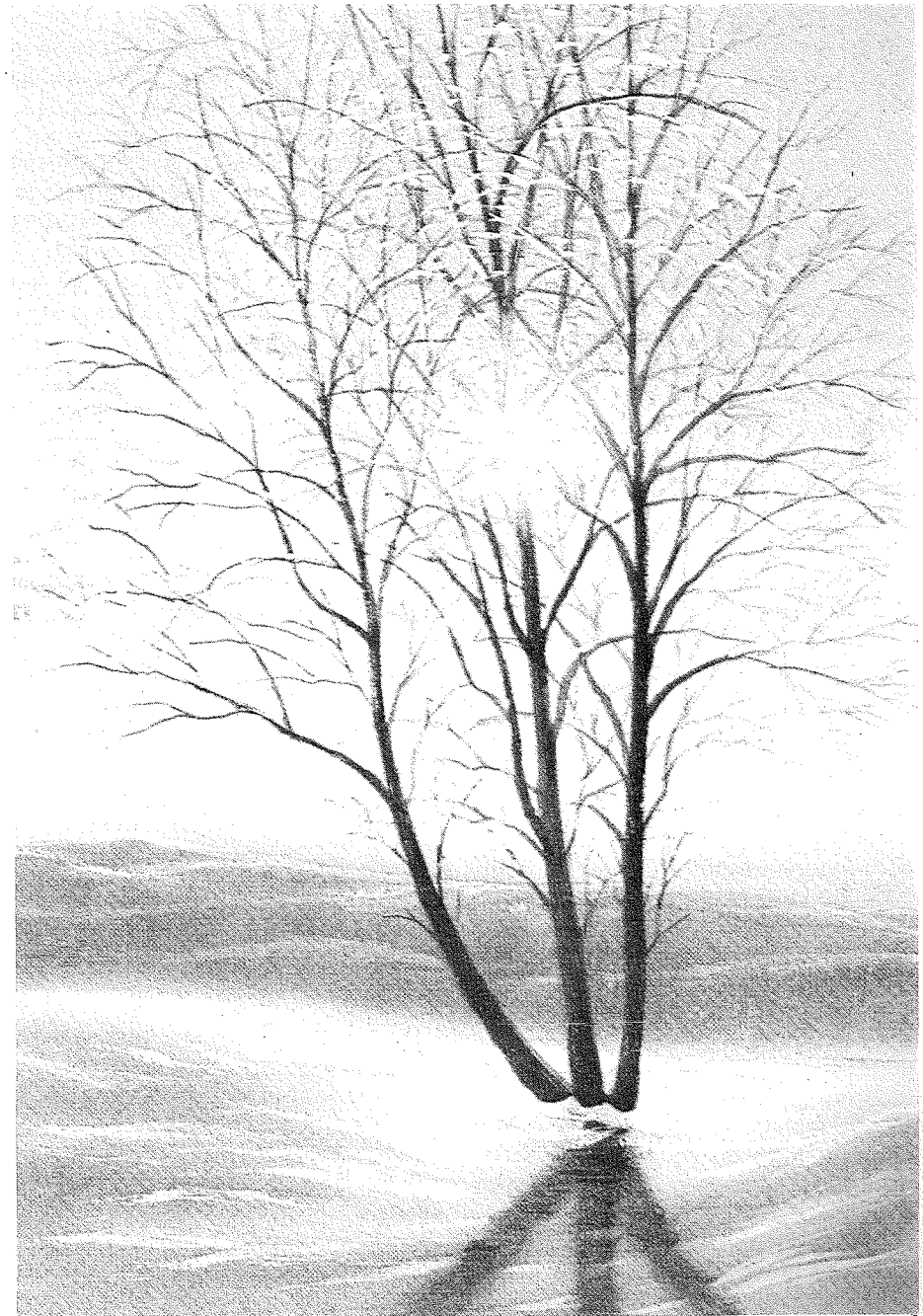
Зимовий пейзаж із зіркою.

До тієї мети Господь вибрав Собі вірну людину — пророка, який говорив слово в ім'я Його: „Як живий Господь, Бог Ізраїлів, що перед лицем Його я стою” (1 Цар. 17:1). Такий пророк, — пророк огню, у слові й у ділі, дав і цареві, й усьому народові виклик на спеціальне змагання щодо правдивости Бога і правдивости релігії. „Чи довго ви будете скакати на двох галузках? Якщо Господь — Бог, ідіть за Ним, а якщо Ваал — ідіть за ним!” (1 Цар. 18:21). Для зібраного народу на горі Кармель він дав пропозицію поставити два жертovníки: один для Ваала, а другий для Господа. А спробою правдивости Бога мало бути те, щоб Бог Сам послав огонь на жертovníк без помочі рук людських. Отже, це мала бути надприродна дія: Нехай правдивий Бог Сам докаже Своє існування і Свою правдивість святим вогнем із неба. Надприродне чудо нехай буде евіденцією правдивости Бога! Це був поважний виклик і сміливий акт віри в живого Бога. (Далі буде)