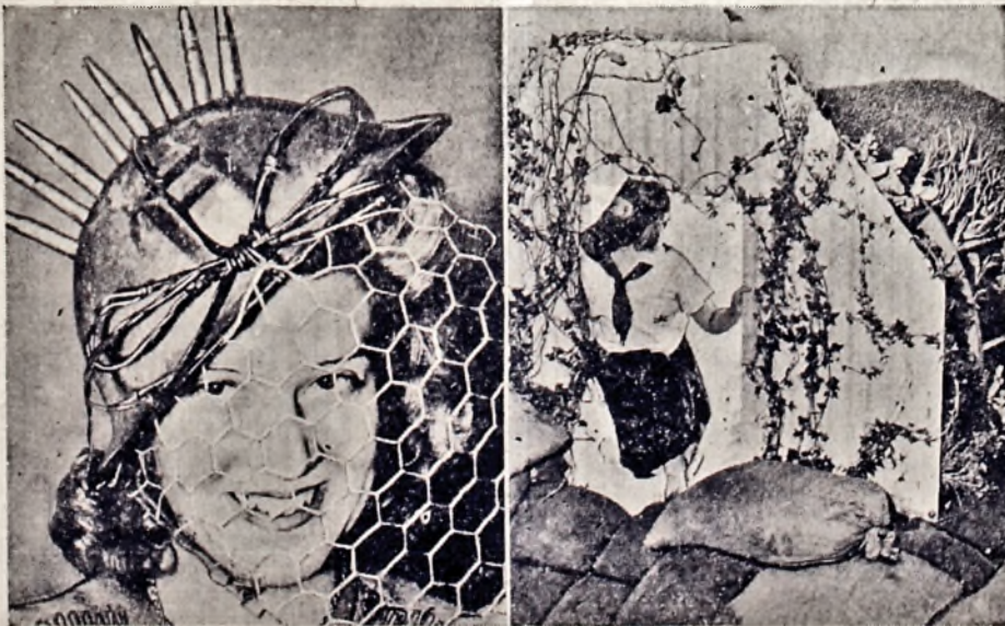
Зліва: Найновіший продукт американської моди — сталевий шолом з чавів світової війни зразком жіночого капелюха. — Зправа: На виставі квітів у Нью-Йорку загальну увагу звертав на себе британський бомбовий сховок, зроблений з піску і квітів.