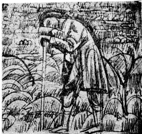
Чабан, Львів 1912 р. Наліво: Біля буфету, Київ 1923.

На обох рисунках кидається ввічі ритміка лінійного укладу. В „Чабані“ профільно поставлена голова та симетрична поза цілості займають центр картини. Основна лукова лінія йде назовні від голови до кінця свити. Півкрутом охоплений рукав спертої на ціпку руки та дещо лагідніша крива обіймає коліна. Відповідником їх є прості лінії ніг, від колін та ціпка. Такими ж луковими лініями змальоване стадо овець. — Подібна схема рисунку „Біля буфету“. Тут видно той евритимічний лад у паралелізмі кривої плечей і темної плями над ними. Вона замикає щільніше наклін фігури. Протилежна сторона спадає прямими лініями вниз. Замітне, що тут продовжена трохи лінія руки. Мистець з розмислом кинув між торсом і рукою темну пляму для підкреслення суцільності і статичності фігури. Рівнобіжно з горизонтальною лінією стола йде рука дитини, її перетинає вертикально правниця, що держить склянку.