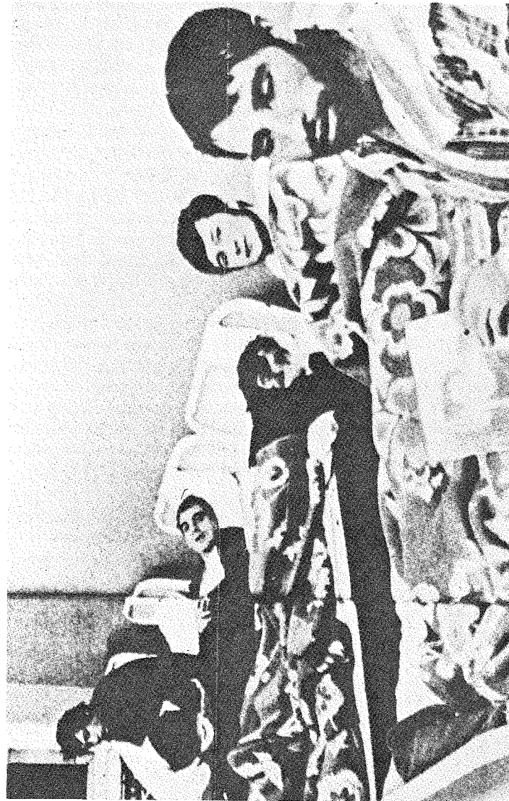
Жертви психіатричних лікарень-в'язниць.

3 грудня 1972 року сенатор Джеймс Істленд, голова сенатського підкомітету по питаннях внутрішньої безпеки, оприлюднив