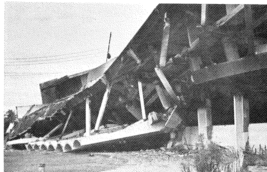
Після землетрусу у Філіппінах.