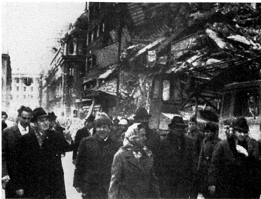
Руїни Бухареста, столиці Румунії, після землетрусу в березні 1977 року.

ням понад 800 000 мешканців було цілком знищене, а також велике руйнування будинків сталося в сусідніх великих містах як Пекін, столиця Китаю, та промислове місто Тяньдзінь. Хоч офіційних повідомлень не подано, проте деякі західні знавці, які були в тій околиці, обраховують вбитих понад 700 000 людей,