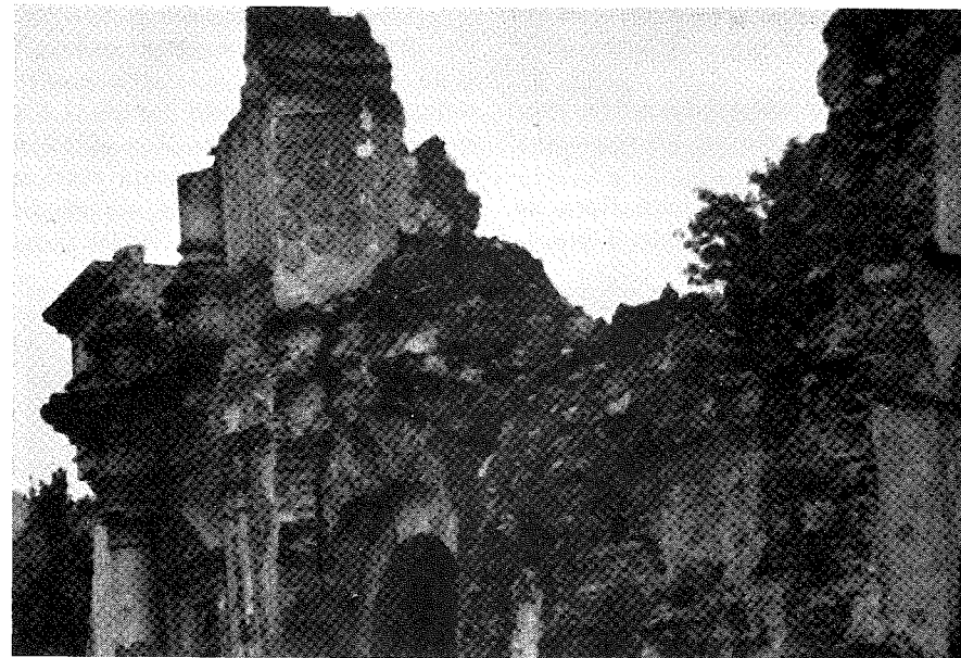
Наслідки землетрусу у Гватемалі.

6 травня в північно-східній частині Італії міста та села на північ від Венеції зазнали сильного знищення сильним землетрусом, загинуло 1 000 людей, 400 пропало, а 2 000 людей поранено. Повторні