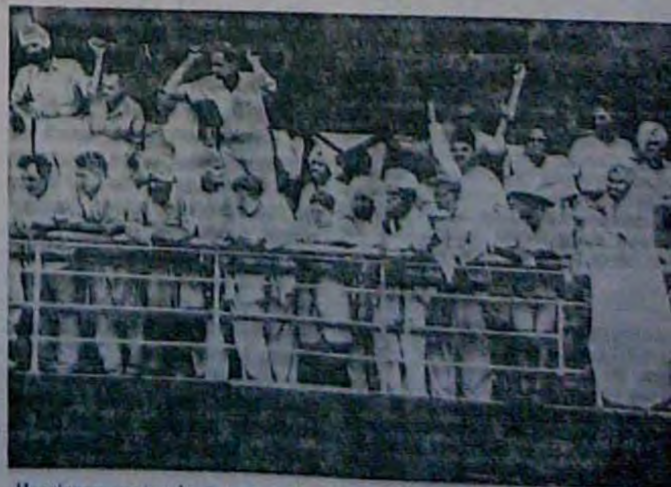
Наслідком політичної війни на дві держави, Індусія і Сиккі, що знають у Пакистані, повертаються до Індії, а мусульманська Індія повертається до Пакистану. На фототег Група з 100 індусів і сикків, що втекла з Пакистану амеріканським кораблем „Dwarka“, прибула до Бомбея.

ВАШІНґТОН. (РІПТ). 2 жовтня. Президент Трумен звернувся в середу до американського народу з закликом менше споживати хліба, щоб таким чином зберегти 100 мільйонів збіжжя для допомогової акції європейським країнам. Виступаючи на першому засіданні новоствореного „Харчового комітету“, Трумен вимагав далі зменшити витрати збіжжя на годівлю худоби і знизити ціни на збіжжя.