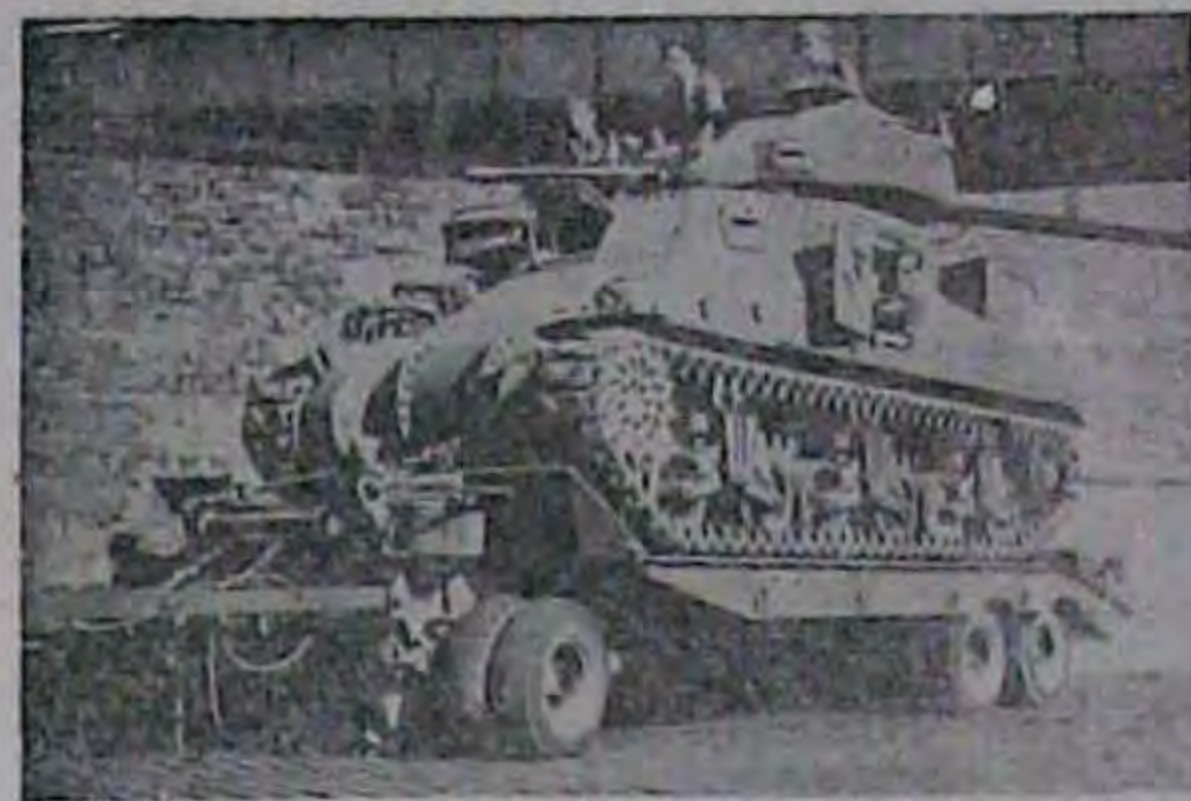
Англійський фельдмаршал Монтегю користувався цим танком, поцуплений від Єгипту й аж до кінця війни. Відтепер танк переміщено в Австрію до Англії, де його показуватимуть як пам'ятку про недавню війну. (Дева-НІТ-Біла)

О. Вишнівський, К. Смовський, М. Стечишин, М. Рибчук, Л. Валійський. 2. 10. 47.