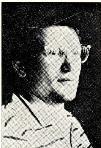
Андрій О. Амальрик

Андрій Олексійович Амальрик народився 1938 року в Москві, в родині історика. В роках 1959-60 і 1962-63 вчився в Москві на історичному факультеті Московського університету, звідки й був виключений за працю «Нормани і Київська Русь». Перед і після університету працював картографом, медичним лаборантом, робітником на будівництвах, освітлювачем на кінохроніці, перекладачем технічної літератури, коректором часописів, хронометристом на автових змаганнях, натурщиком, давав лекції математики і російської мови. В 1963-64 написав п'ять п'ес, в тому числі і «Схід-Захід» — про відно-