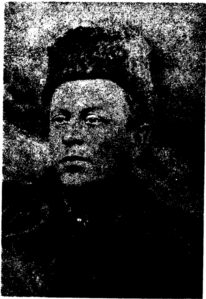
Головний Отаман С. Петлюра, Президент У.Н.Р., 1919-1920