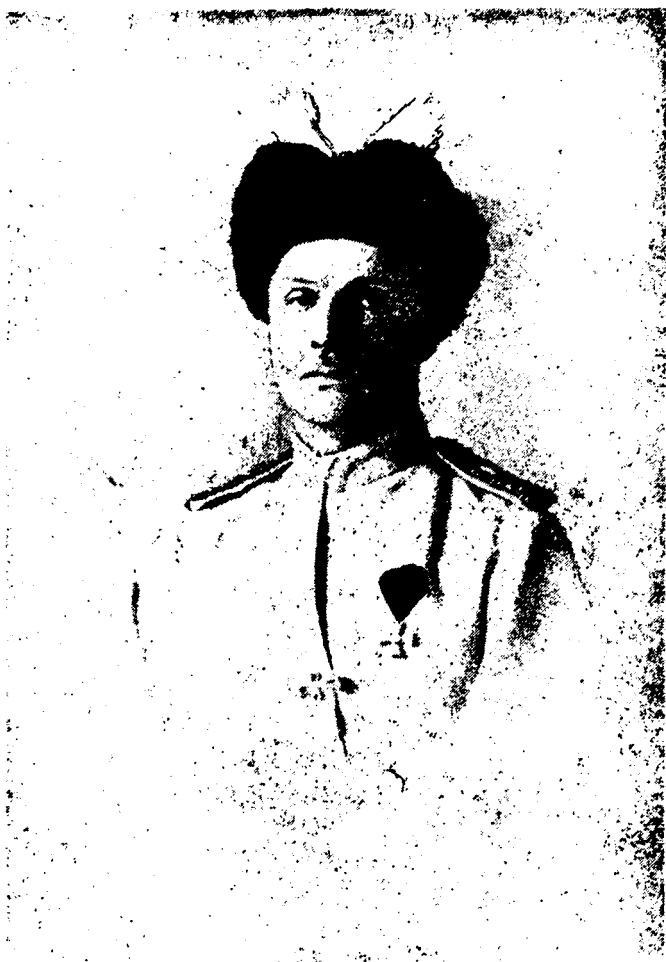
Генерал П. Скоропадський, Гетьман Української Держави, 1918