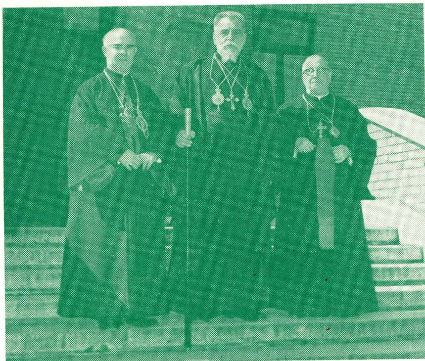
На цій знімці бачимо Митрополита Канади Кир Максима Германюка, МИТРОПОЛИТА-ІСПОВІДНИКА КИР ЙОСИФА СЛІПОГО і Архипастиря Скитальців Кир Івана Бучка. — Ця знімка зроблена дня 5 березня 1963 р. у Ватикані.