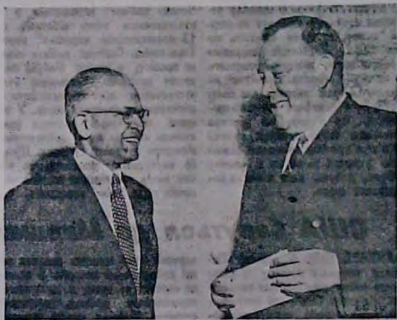
15-го серпня 1947 р., в день проголошення самостійности Індії, генеральний секретар ООН Трігне Лі перелав новому делегатові вільної Індії вірчу грамоту. На фото: Трігне Лі (праворуч) розмовляє з новим представником Індії д-ром П. Т. Піллай.

Навіть Маршалів план тісно пов'язаний з ідеологічним змістом