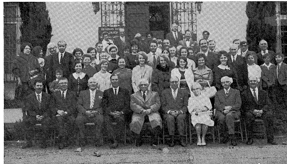
Учасники Свята Подяки в Санта-Барбара

Наша громада живе духовним життям, горить усім серцем до діла Божого та палає любов'ю до Господа. Ми відбуваємо свої регулярні Богослуження, влаштовуємо спеціальні свята, як “День Подяки”, тощо, і таким чином маємо привілей вітати у нашій живій громаді