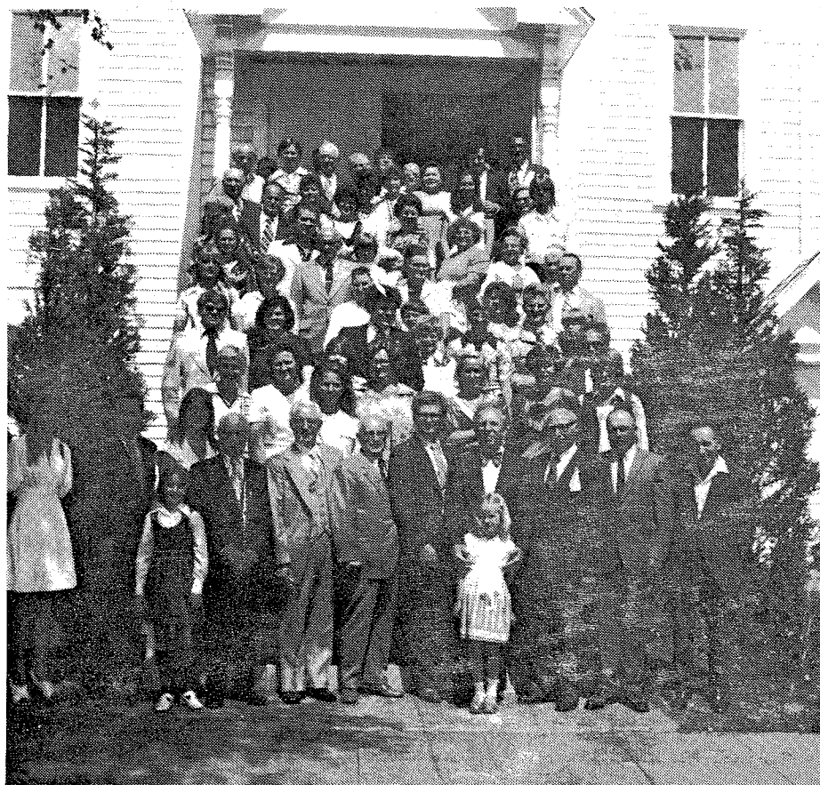
Учасники 15-го З'їзду Західного Українського Єв. Бапт. Об'єднання.