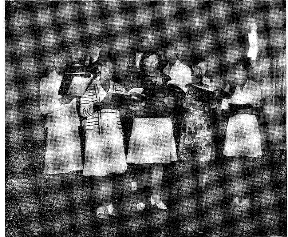
Хор молоді, що брав участь в урочистих святкуваннях на 15-му З'їзді Ук. ЄвБ Об. Всі співаки — члени Пер. Ук. ЄвБ. Церкви в Бурлінгейм

— Бог живе в кожній людині, але не кожна людина живе в Бозі. В тому причина страждання людей."