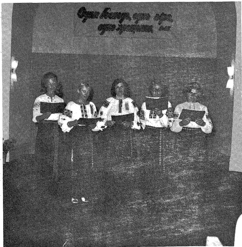
Квнтет сестер Церкви в Бурлінгейм.

Зліва направо: с. Котов, с. Бодрук, с. Коровник, с. Татусь, с. Теслю, які співали на 15-му З'їзді УкЄБОБ.