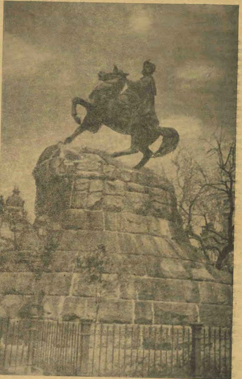
Пам'ятник Б. Хмельницькому в Києві

І це тоді, коли на світ божий повлазили різні Пушкіни, Анфіси Павлівни і Павлівни Анфісовни. Хмарою насувають якісь чужі партійні апаратники, ті шурі на двох ногах, ті безідейні суттю пройди-світи, що цинічно прикриваються соціалізмом і в українських установах або покривають: «Што тут развешали різних Мазепов і Коцюбинських», або глибокодумно зауважують — «проехал двесті вюрст по Україні і не нашол мови, но зато, правда, нашол українскіе настронія» («Силуети»). Ці трутні