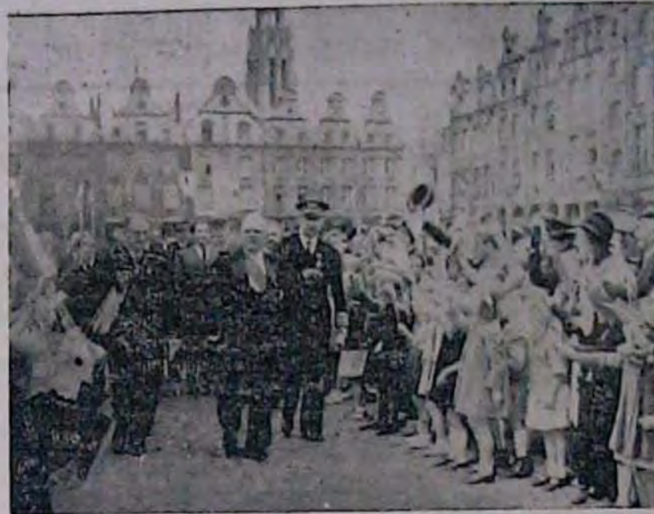
14-го липня Франція урочисто відзначала національне свято повалення Бастилії. На фото: Населення містечка Лізь гучно вітає французького державного президента Орліоза на „площі Героя“.