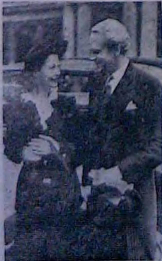
Знаменитому авторові (англійському) ром Гамлету Л. Оліве в англійській королівській академії дворянства.

„Відповідаючи загальним вимогам допомогової акції та ілуча назустріч загальним українським побажанням по цей і по той бік океану, Злучений Американський Допомоговий Комітет приступив до видачі своїх окремих „Вістей“, подуманих позицію як неперодичний додаток до двох наших часописів „Свобода“ й „Америка“. Перше число цього додатку появилося вже в першій половині травня та було посвячене виключно ризикуюч.