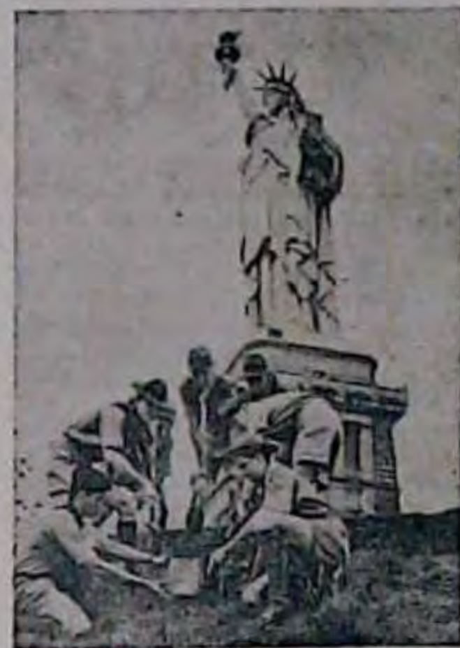
9 го серпня поблизу Парижу відбується зустріч пластуни з усього світу.

Всі потреби пластуни мають бути задоволені тут же на місці: поруч стадіону відкривається великий ярмарок, де будуть склепи з пластовими вирядами, спортовим при-