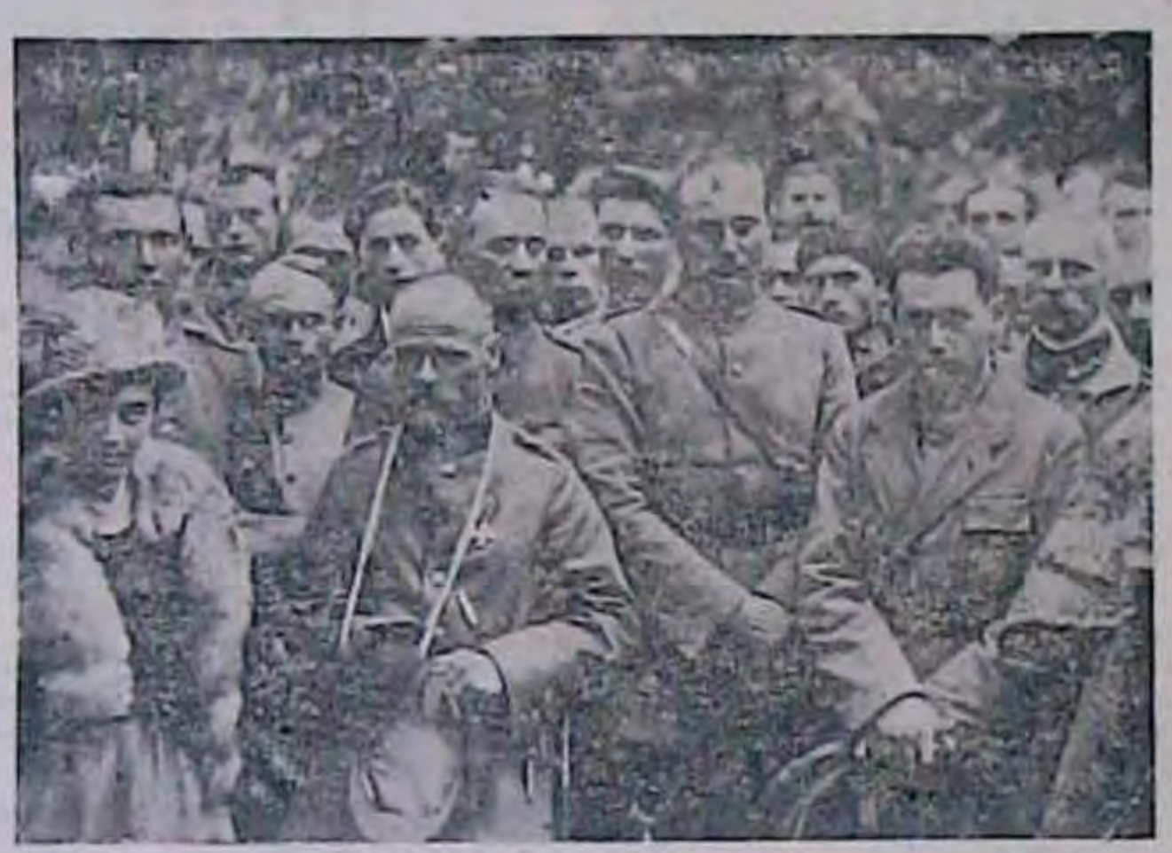
На похороні старшини. (1920 р. Протибольшевинький фронт Двістра. На передикому плині-ген. Омелянович-Павленко).

Відліли поляків з дільниці фронту Перемишль та Городок Ягеллон-