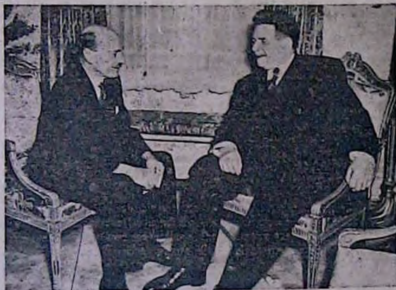
Голова французьких Національних Зборів Ерро з 1-го до 4-го липня перебував у Лондоні як гість англійського уряду. На фот.: Ерро розмовляє з англійським міністер-президентом Етлі.

З другого боку, представники західно-європейських держав зібралися, щоб обміркувати засади і плани координування своїх дій і, мимомовно всіх сподівань Москви, без яких розривувалось протягом 3-4 днів вирішили висвітлити свої внутрішні економічні можливості і потреби і скласти план, в чому саме потрібна їм допомога з боку США. Ще раз Бевін заявив, що ця