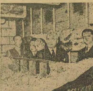
Президент Е. де Ніколя (другий з правого боку наліво) оглядає модель мосту під час відкриття залізничної виставки. (Дена-НІТ-Більд).

Отже, першорядним питанням для нас, як також і для ряду інших народів, є визволення, є державна незалежність, а потім стає на чергу уже об'єднання і співпраця — тобто федерація з іншими народами. І ми не можемо примиритися з тим, щоб, будуючи СШЕвропи, європейські народи допустилися того, щоб ряд народів лишився поза нею. СШЕвропи можливі на основі економічної і соціальної співпраці народів, що стає засадою, де кожна нація творить свій національний економічний комплекс як ланку загальної економічної системи. Сучасна Європа можлива тільки як економічна цілість.