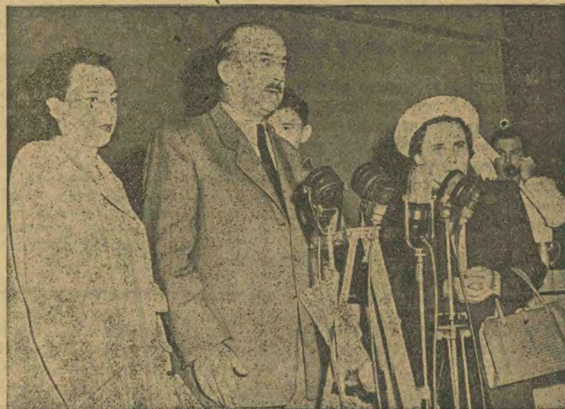
Кол. угорський міністер-президент Ф. Надь разом з своєю родиною прибув 15-го червня до Нью-Йорку і після прибуття виголосив промову до американського народу.

На фото: Ф. Надь під час промови. Зліва направо: його дочка, Ф. Надь, його п'ятилітній син і його дружина.