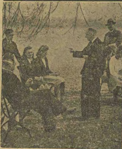
Після страждання і мук протягом довгих військових років знову наука в високій школі.

Єпископ Кузів відвідав студентський гуртожиток, мешкання і відбув з студентами шире теплу розмову.