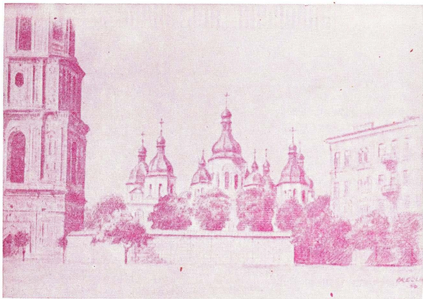
Св. Софія в Золотоверхому Києві, столиці України