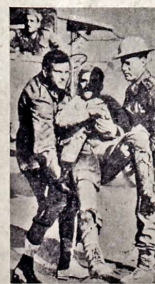
Бритійський офіцер й італійський полонений рятують разом раненого італійського воєнка. Другий ранений воєнка чекає на землі на поміч цієї хвилевої спілки двох ворогів. Сцена сфотографована біля Бенгазі, в африканській Лівії.