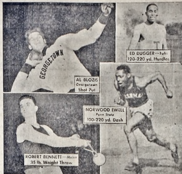
The twentieth annual indoor track and field championships of the Inter-Collegiate Association of Amateur Athletes of America will be held in New York City on March 1, at Madison Square Garden. These photographs show last year's champions, who will compete again this year in defense of their titles.

terruption in the telling. The books starts with a minimum of introduction and goes right into the story itself. Each character is a typical Wild Western type: the sneering bad man who will kill at the drop of an insult; the jealous rival for the position who snivels away from righteousness into the camp of evil; the good kind friend of the hero who has faith in him even when things look at their worst; the two aids of the sheriff, always clowning, who prove to be real men when the test comes; and the beautiful girl who is in danger but is good through it all, and then marries the hero.