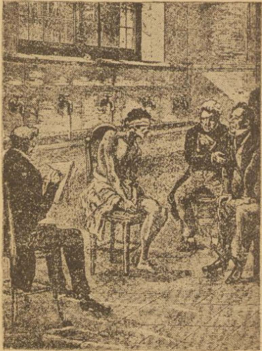
Сила впливу Сугестії.