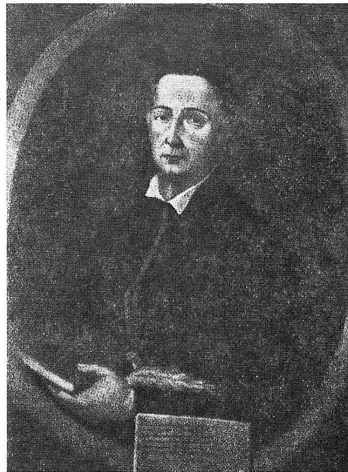
Видатний педагог і письменник Г. Сковорода (1722-1794), передвісник євангельсько-баптистського руху в Україні.

Торонто, Канада, місяця жовтня, року Божого 1968.